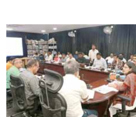
అధికారుల సమావేశంలో మాట్లాడుతున్న కమిషనర్ అబితి సింగ్

తిరుపతి ఎడ్యుకేషన్, మేజర్ న్యూస్: స్టార్డ్ సిటీ కార్పొరేషన్ ద్వారా చేపట్టిన అభివృద్ధి పనులను వేగవంతం చేయాలని స్టార్డ్ సిటీ ఎం.డి, కార్పొరేషన్ కమిషనర్ అబితి సింగ్ అధికారులను ఆదేశించారు. గురువారం కార్పొరేషన్ కార్యాలయంలో స్టార్డ్ సిటీ అధికారులు, ఇంజనీరింగ్ అధికారులు, పనులు చేపట్టిన కాంట్రాక్టర్లతో సమావేశం నిర్వహించారు. ఐటిఐఎల్ సి పనులు నెమ్మదిగా సదుస్తున్నాయని, పనులు వేగవంతం చేయాలన్నారు. కచ్చిఫి ఆర్ట్ బ్లాక్ వద్ద ఏర్పాటు చేయబోవు కమాండ్ కంట్రోల్ సెంటర్ పనులను త్వరగా పూర్తి చేయాలన్నారు. సిటీ ఆపరేషన్ సెంటర్ పనులపై వేగవంతం చేసేందుకు దృష్టి సారించాలని, ముఖ్యంగా సిడిసి బిల్డింగ్ పూర్తి చేయడంతో మునిసిపల్ కార్పొరేషన్ కార్యాలయం ప్రజలకి అందుబాటులోకి వస్తుందనే విషయాన్ని