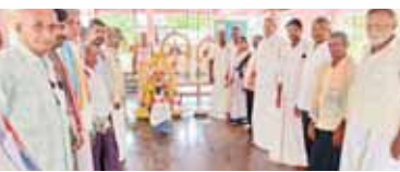
మహాభారతం ఉత్సవాలకు శ్రీకారం కోడి నిర్వహిస్తున్న గ్రామ పెద్దలు

వెంరుకుప్పు, మేజర్స్ న్యూస్: పచ్చికాపలం శ్రీకృష్ణ ద్రౌపతి ధర్మరాజుల ఆలయంలో మహాభారతం ఉత్సవాలకు గురువారం శ్రీకారం కోడి కార్యక్రమం అత్యంత వైభవంగా జరిగింది. శ్రీకారం కోడి కార్యక్రమాన్ని పురోహితులు శాస్త్రోక్తంగా నిర్వహించారు. ఆలయానికి సంబంధించిన గ్రామ పెద్దలు కార్యక్రమానికి హాజరయ్యారు.