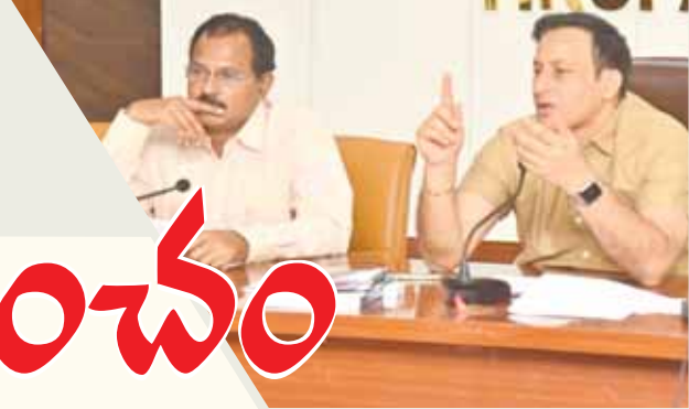
- జిల్లా కలెక్టర్ ప్రవీణ్ కుమార్