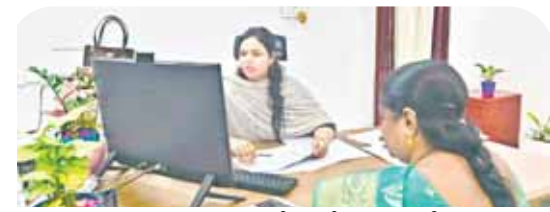
అధికారులకు దిశా నిర్దేశం చేస్తున్న ఏఆర్ఓస్, నగరపాలక సంస్థ కమిషనర్ అరుణ

చిత్తూరు కార్పొరేషన్, మేజర్ న్యూస్: నగర పాలక పరిధిలోని అన్ని పోలింగ్ కేంద్రాల్లో మౌలిక సదుపాయాల ఏర్పాటు సత్వరం పూర్తి చేయాలని ఏఆర్ఓస్, కమిషనర్ డా. జె ఆరుణ ఇంజనీరింగ్ విభాగం అధికారులు, వార్డు అమినిటీ కార్యదర్శులను ఆదేశించారు. శుక్రవారం మధ్యాహ్నం పోలింగ్ కేంద్రాల్లో కనీస మౌలిక సదుపాయాల కల్పనపై అధికారులతో సమీక్ష నిర్వహించారు. పోలింగ్ కేంద్రాల్లో బారికేట్ల నిర్మాణం, సామియానా, విద్యుత్ లైట్ల ఏర్పాటు సాయంత్రానికి పూర్తి చేయాలన్నారు. పోలింగ్ కేంద్రాల్లో ఇప్పటికే పూర్తిచేసిన విద్యుత్ కరెన్షల్ భాగంగా స్విచ్ బోర్డులు, లైట్లు, ఫ్యాన్లు సక్రమంగా పనిచేస్తున్నాయో లేదో చెక్ చేయాలన్నారు. పోలింగ్ కేంద్రాల్లో పెండింగ్ పనులన్నీ శుక్రవారం సాయంత్రానికి పూర్తి చేయాలని ఆదేశించారు. అనంతరం పోలింగ్ కేంద్రాల్లో పారిశుధ్య పనులు, మరుగుదొడ్ల నిర్వహణపై ప్రజారోగ్య విభాగం అధికారులు, వార్డు పారిశుధ్య పర్యవరణ కార్యదర్శులతో సమీక్షించారు. పోలింగ్