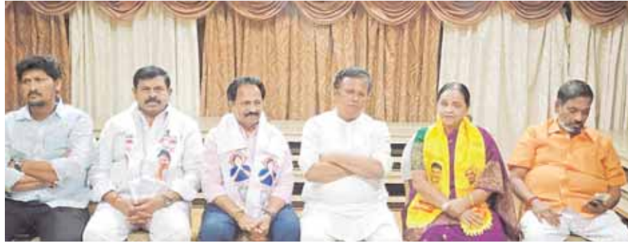
చేస్తే గుమ్మడికాయల దొంగ అంటే భుజాలు తడుము ఉందన్నారు. తాను జనసేన పార్టీ తిరుపతి నియోజక కున్న చందంగా వైసీపీ వ్యవహారించడం విద్వేషంగా వర్ణం అజ్జర్నల్ గా అధికారకంగా పార్టీ నియమించింది

ఓటమి భయంతోనే జనసేనపై విమర్శలు గుమ్మడికాయల దొంగ అంటే భుజాలు తడుముకున్న వైసీపీ : ఏ ఎం రత్నం