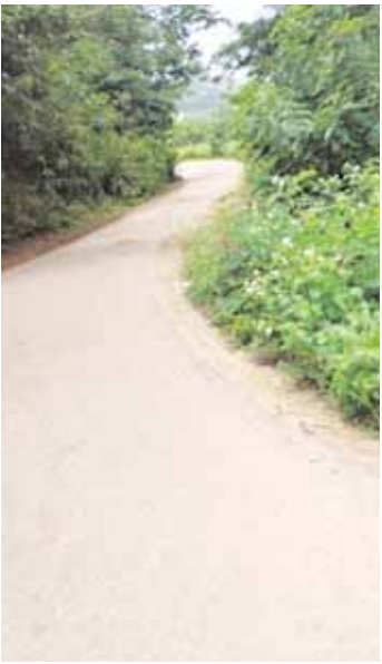
లను నివారించాలని స్థానికులు గ్రామ ప్రజలు కోరుతున్నారు.

పోవడంతో కొత్తగా వచ్చే వాహనాలు ఇబ్బందులు గురి కావడంతో పాటు అదుపు తప్పే ప్రమాదం లేకపోలేదు. కొద్దిగా స్పీడుగా వచ్చే వాహనాలు సైతం ఈ మలుపు వద్ద కంట్రోల్ చేయలేక డ్రైవర్లు ఇబ్బందులు పడుతున్నారు. ఇక్కడ సూచిక బోర్డులు ఏర్పాటు చేస్తే కనీసం సూచిక బోర్డులను గమనించి స్పీడు తగ్గించి ప్రమాదాల బారిన పడకుండా జాగ్రత్తలు వహించే అవకాశం లేకపోలేదు. దీంతో పాటు మలుపు వద్ద ఎలాంటి విద్యుత్ దీపాలు లేకపోవడంతో రాత్రుల్లో వాహన దారులకు ఇబ్బందులు తప్పడం లేదు. అదే విధంగా స్పీడు బ్రేకర్లు సైతం ఏర్పాటు చేసి వాటికి సూచిక బోర్డులు ఏర్పాటు చేయాలని నూతుకుంటపల్లి మరియు వేపకుప్పం గ్రామస్థులు కోరుతున్నారు. సంబంధిత అధికారులు విద్యుత్ దీపాలు ఏర్పాటు చేసి ప్రమాద