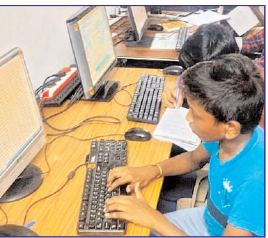
కార్యక్రమం చేస్తున్నామని, అంతేకాకుండా ఉచిత నారాయణ సేవలో భాగంగా రోజుకు మూడు పూటలు నిత్యాన్నదాన కార్యక్రమం చేస్తున్నామని