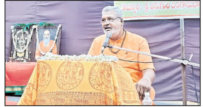
అతిగా నిద్రించువానికిని, ఎల్లప్పుడు మేల్కొనియుండు వానికిని ఈ యోగ సిద్ధి కలుగదని తెలిపారు.