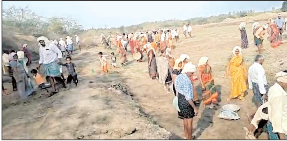
వీక్షిత్ బాక్సు, ఉపాధి కూలీలకు అందుబాటులో ఉండడం లేదని విమర్శలు పెద్ద ఎత్తున వినిపిస్తున్నాయి. జిల్లా స్థాయి ఉన్నతాధికారులు

నూజెండ్ల మేజర్ న్యూస్: కేంద్ర ప్రభుత్వం ఆధీనంలో నడుస్తున్న మహాత్మాగాంధీ జాతీయ ఉపాధి హామీ పనులు నూజెండ్ల మండలంలో అస్తవ్యస్తంగా సాగుతున్నాయి. వేసవికాలం కావడంతో ఉపాధి కూలీలకు సౌకర్యాలు కల్పనలో మండల అధికారులు పెద్దగా పట్టించుకోవడంలేదని ఆరోపణ వినిపిస్తున్నాయి. ఉపాధి కూలీలకు 42 డిగ్రీల పైబడిన ఉష్ణోగ్రత ఉన్న కాలంలో కొరవడిగా నీడ కల్పించడంపై ఉపాధి కూలీ అధికారుల పనితీరుపై అగ్రహారం వ్యక్తం చేస్తున్నారు. వేసవి కాలంలో ఉపాధి కూలీలకు కొన్ని ప్రత్యేక కల్పించవలసి ఉంటుంది. ఉపాధి కూలీలకు నీడతో పాటు మంచినీళ్లు, మజ్జిగ ప్యాకెట్లు, ప్రథమ