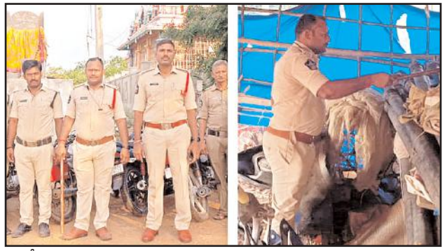
రాజకీయ అల్లర్లకు దూరంగా ఉండటం సైకిక్ హక్కుగా ప్రతిఒక్కరు భావించాలి అని ఈ సందర్భంగా పోలీసులు తెలిపారు.

సూజెండ్ల, మేజర్ న్యూస్ సార్వత్రిక ఎన్నికల అనంతరం మండలంలోని పలు గ్రామాల్లో జరిగిన అల్లర్లకు పోలీసులు చెక్ పెట్టారు. గ్రామాల్లో పటిష్ట బందోబస్తు ఏర్పాటు ఎటువంటి అవాంఛనీయ సంఘటనలు జరగకుండా చర్యలు చేపట్టారు. ఐనవోలు పోలీసులు మండలంలోని జింగాలపల్లి గ్రామంలో కార్టన్ సెన్స్ నిర్వహించారు. గ్రామంలోని ప్రతి ఇంటిని జిల్లెడ పట్టారు. గ్రామంలో మారణాయుధాలు, నాటు బాంబులు ఏమైనా ఉన్నాయో అని సోదాలు నిర్వహించారు. అయితే గ్రామంలో ఎక్కడకూడా ఎటువంటి మారణాయుధాలు దొరకలేదని పోలీసులు తెలిపారు. అనంతరం గ్రామంలోని ఎటువంటి పేపర్ లేని కొన్ని బైకులను స్వాధీనం చేసుకున్నారు. అనంతరం గ్రామ ప్రజలకు కొన్సైలింగ్ నిర్వహించారు. ఎటువంటి అల్లర్లకు పాల్పడి జీవితాలు నాశనం చేసుకోవద్దని, ముఖ్యంగా యువత ఇటువంటి రాజకీయ అల్లర్లకు దూరంగా ఉండాలని హితవు పలికారు. ఓటు వినియోగించుకోవడం పొరుడి ప్రాథమిక హక్కు అయితే