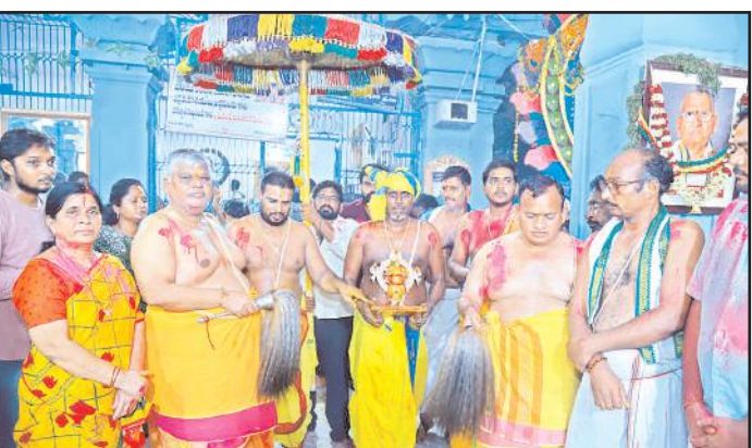
కృష్ణానది పుష్కరిణిలో సుదర్శన స్వామి వారికి తిరుమంజనం పూజాది కార్యక్రమాలు చేపట్టారు. అనంతరం సుదర్శన చక్రతీర్థార్చకు పుష్కరిణిలో