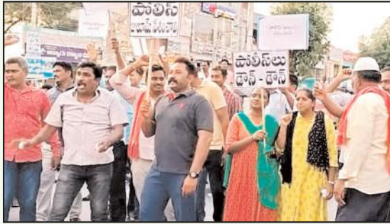
వినుకొండ, మేజర్ న్యూస్