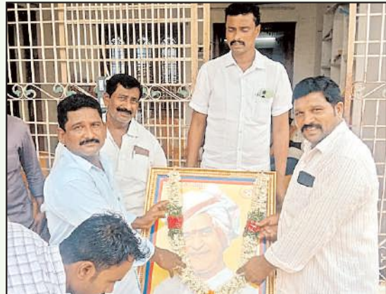
ఈవూరు, మేజర్ న్యూస్

తెలుగుదేశం పార్టీ వ్యవస్థాపకులు, మాజీ ముఖ్యమంత్రి దివంగత నంద మూరి తారక రామారావు 101వ జయంతి ఉత్సవాలను పార్టీ శ్రేణులు ఘనంగా జరుపుకున్నారు. మండలంలోని బోడెనెంబునివారి పాలెం, కొండ్రముట్ల, కొచ్చర్ల, అంగలూరు, ఉప్పరపాలెం, ఈవూరు ముప్పాళ్ళ, తదితర గ్రామాల్లో ఎన్టీఆర్ అభిమానులు, టిడిపి నాయకులు జయంతి వేడుకలను ఘనంగా నిర్వహించారు. తొలిత ఎన్టీఆర్ చిత్రం టానికి పూల మాల వేసి నివాళులు అర్పించారు. అనంతరం నాయకులు మాట్లాడుతూ తెలుగువారి గొప్పతనాన్ని ప్రపంచానికి చాటిన ఘనమైన మన ఎన్టీఆర్ అని కొనియాడారు. బడుగు బలహీన వర్గాల అభ్యున్నతి కోసం పార్టీని స్థాపించి అభివృద్ధికి పాల్పడ్డారన్నారు. ఈ కార్యక్రమంలో మండల తెలుగుదేశం నాయకులు, కార్యకర్తలు, అభిమానులు పాల్గొన్నారు.