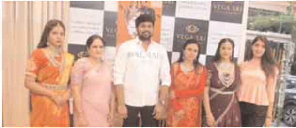
వేగా శ్రీ గోల్డ్ అండ్ డైమండ్స్ అక్షయ తృతీయ ప్రత్యేక ఆభరణాల ప్రదర్శన

సోమాజిగూడ/మేజర్ న్యూస్: అక్షయ తృతీయ సందర్భంగా వేగా శ్రీ గోల్డ్ ఆభరణాల సంస్థ వినియోగదారుల కోసం ప్రత్యేక ఆఫర్లను ప్రకటించింది. ఈ సందర్భంగా నిర్వాహకులు మాట్లాడుతూ పోల్డర్ జ్వెల్లర్ ఆభరణ ప్రీయుల కోసం ప్రత్యేక ఆఫర్లను ప్రకటిస్తున్నట్లు తెలిపారు. తమ వినియోగదారుల కోసం గోల్డ్ కాయిన్ బొనానా పేరుతో 2 లక్షల మరియు పైన 2 లక్షల కౌన్సిగోలకు ఒక 1 గ్రాము గోల్డ్ కాయిన్ ఉచితంగా అందిస్తున్నట్లు తెలిపారు. ఈ ఆఫర్ 9వ నుండి 15వ వరకు మాత్రమే కొనసాగుతుందని, ప్రత్యేక ఆఫర్లను సొంతం చేసుకునేందుకు గాను కొన్ని నిబంధనలు వున్నాయని వారు తెలిపారు.