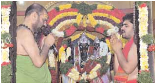
ఆల్బాల్, మేజర్ న్యూస్ : భక్తుల కొంగుబంగారమై, భక్తులు సర్వభిష్టాలను నెరవేరుస్తూ విరాజిల్లుతున్న మరకత శ్రీ లక్ష్మి గణపతి కి బుధవారం ప్రత్యేక