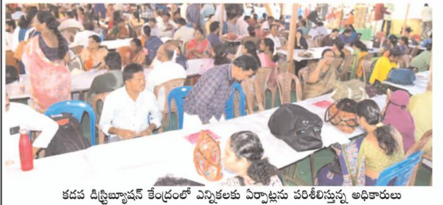
కడప డిస్ట్రిబ్యూషన్ కేంద్రంలో ఎన్నికలకు ఏర్పాట్లను పరిశీలిస్తున్న అధికారులు

కడప, మేజర్ న్యూస్ : సాధారణ ఎన్నికల పోలింగ్ కోసం వైఎస్ఆర్ జిల్లాలోని అన్ని నియోజకవర్గాల్లో ఏర్పాటు చేసిన డిస్ట్రిబ్యూషన్ కేంద్రాల్లో ఎలాంటి లోటుపాట్లు లేకుండా జిల్లా ఎన్నికల నిర్వహణా యంత్రాంగం అన్ని రకాల ఏర్పాట్లను సిద్ధం చేసింది. మరోవైపు శనివారం రాత్రి జిల్లా ఎన్నికల అధికారి, జిల్లా కలెక్టర్ వి.విజయ్ రామరాజు.. పోలింగ్ సిబ్బందికి 3వ విడత ర్యాండ్ మైజేషన్ ద్వారా ఆయా నియోజకవర్గాల్లో పోలింగ్ స్టేషన్లకు డ్యూటీలను కేటాయించారు. సిబ్బందికి మొత్తం మెసినీల ద్వారా సందేశాలను కూడా పంపడంతో.. ఎన్నికల సిబ్బంది ఆదివారం ఉదయం 7 గంటల్లోగా డిస్ట్రిబ్యూషన్ కేంద్రాల్లో హాజరై.. ఎన్నికల సామాగ్రిని తీసుకుని వారికి పోలింగ్ కేంద్రాలకు.. ఆయా రూట్లలో వెళ్ళే వాహనాల్లో వెళ్ళనున్నారు. కాగా.. మెటీరియల్ పంపిణీ సజావుగా జరగాలని జిల్లా ఎన్నికల అధికారి, జిల్లా కలెక్టర్ వి.విజయ్ రామరాజు ఆదేశాలు జారీ చేయడంతో.. డిస్ట్రిబ్యూషన్ కేంద్రాల్లో వర్షం వచ్చినా తడవకుండా షామియానాలకు వాటర్ ఫ్రామ్స్ ఏర్పాట్లను సిద్ధం చేశారు. ఉదయం ఏడు గంటలకే వచ్చే ఎన్నికల అధికారులకి డిస్ట్రిబ్యూషన్ కేంద్రాల్లోనే వారికి టిఫిన్, ప్యాక్డ్ లంచ్ ఏర్పాట్లు చేయడం జరిగింది.