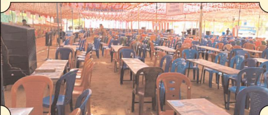
కమలాపురంలో ఓటింగ్ కోసం ఏర్పాటు చేసిన ఎన్నికల అధికారులు