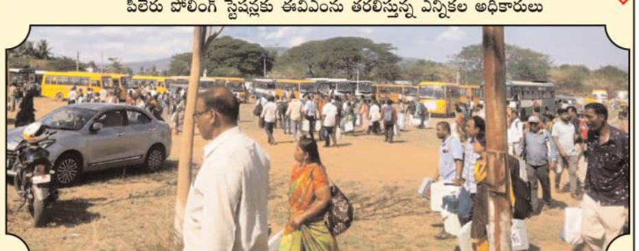
రైల్వే కోడూరులో డిస్ట్రిబ్యూషన్ కేంద్రం సుంచి పోలింగ్ కేంద్రాలకు ఈవిఎంసె తీసుకెళ్తున్న సిబ్బంది