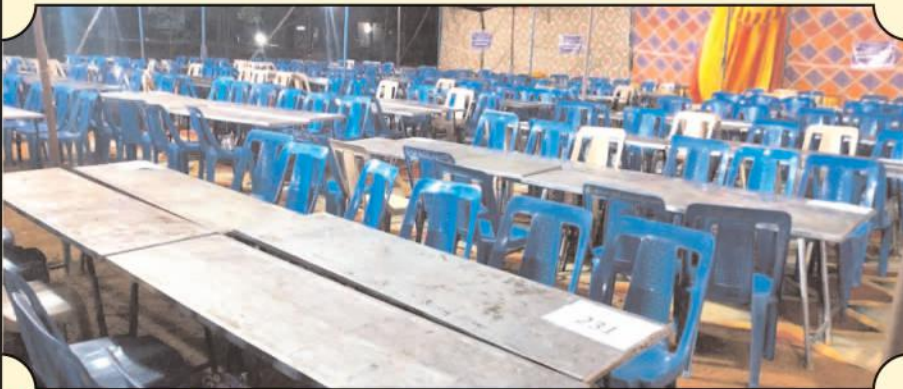
మైదుకూరులో ఓటింగ్ కోసం ఏర్పాటు చేసిన ఎన్నికల అధికారులు