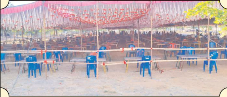
బద్వేలులో ఓటింగ్ కోసం ఏర్పాటు చేసిన ఎన్నికల అధికారులు