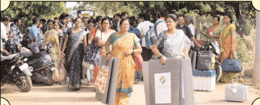
ఎన్నికల విధులకు తరులుతున్న మహిళా అధికారులు