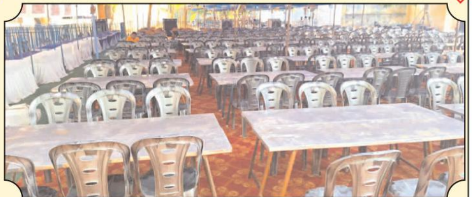
కడప ఆర్డ్ర్ కాలేజీలో ఓటింగ్ కోసం ఏర్పాటు చేసిన ఎన్నికల అధికారులు