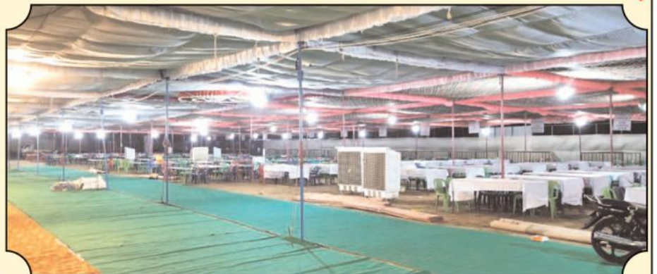
ప్రొద్దుటూరులో ఓటింగ్ కోసం ఏర్పాటు చేసిన ఎన్నికల అధికారులు