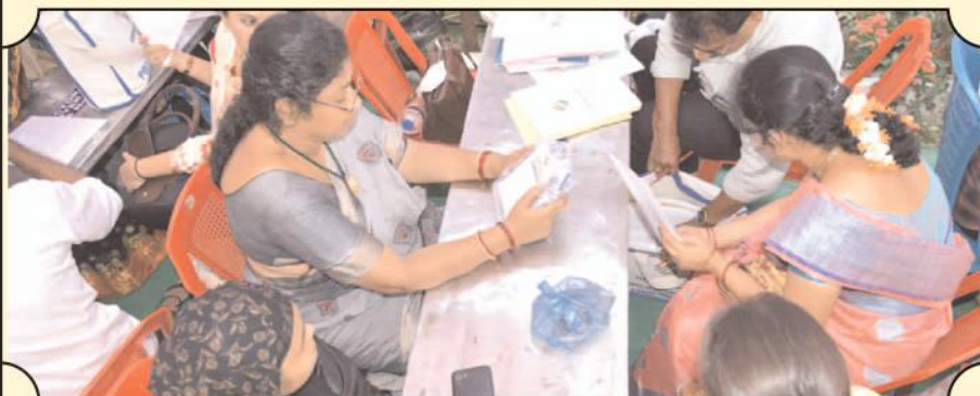
రాయచోటి సాయి ఇంజనీరింగ్ కళాశాలలో ఓటింగ్ కోసం ఏర్పాటు పరిశీలుస్తున్న ఎన్నికల అధికారులు