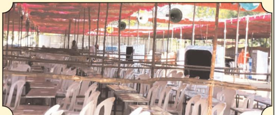
జమ్మలమడుగులో ఓటింగ్ కోసం ఏర్పాటు చేసిన ఎన్నికల అధికారులు