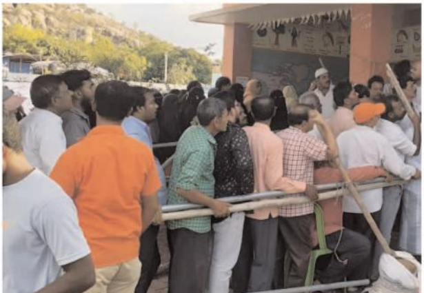
అధ్యక్షతన ప్రత్యేక నిఘా ఏర్పాటు చేశారు, అయితే కొన్ని పోలింగ్ కేంద్రాల్లో ఓటర్లకు మౌలిక సదుపాయాలు అధికారులు విఫలమయ్యారు.

పెద్దమండ్యం, మేజర్ న్యూస్, మే 13 పెద్దమండ్యం మండలంలో సోమవారం జరిగిన సార్వత్రిక ఎన్నికల్లో ఓటింగ్ ప్రశాంతంగా జరిగింది ,మండలంలో 31 పోలింగ్ కేంద్రాల్లో 28 వేల 250 మంది ఓటర్లు ఉన్నారు ఇందులో సుమారు 80 శాతం మంది ఓటర్లు తమ ఓటు హక్కును వివేగించు కున్నారు, గతంలో కొన్ని పోలింగ్ కేంద్రాల లోవద్ద చిన్నచిన్న గలాటాలు జరిగివి, అయితే ఈ ఏడాది వెబ్ కెమెరాలతో ఏర్పాటు చేయడం వల్ల ప్రజా స్వామ్యబద్ధంగా ఓటు హక్కును ఓటర్లు వినియోగించుకున్నారు ,అయితే కొన్ని పోలింగ్ కేంద్రంలో ఈవీఎంలు మార ఇంచాడమవు వల్ల పోలింగ్ అలస్యమైనది. ఆరు గంటల సమయం ముందే బండమీదపల్లి పంచాయతీ తురకపల్లి, సిద్దివారం పంచాయతీ కోటగుట్టపల్లి, పెద్దమండ్యం పంచాయతీ రెడ్డివారిపల్లి ,శివపురం ,బండ్రేపు ,కలిచెర్ల ఉర్లు ప్రాథమిక పాఠశాల లో ఓటర్లు బార్డు తీరారు, 6 గంటలకు సమయానికి పోలింగ్ కేంద్రాల లోపల ఉన్న ఓటర్లు కు చీటీలు ఇచ్చి ఆతర్వాత వారికి ఓటింగ్ వేయడము జరిగింది, పోలింగ్ కేంద్రాల వద్ద ఎటువంటి అవాంఛనీయ సంఘటనలు జరగకుండా డివిస్యి ప్రసాద్ రెడ్డి