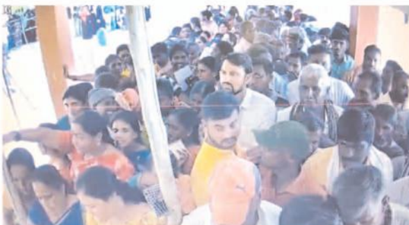
పీలేరు నియోజకవర్గం తలపుల 216 పిఎస్ పోలింగ్ కేంద్రంలో ఉత్సాహంగా క్యూలో నిలిచిన ఓటర్లు