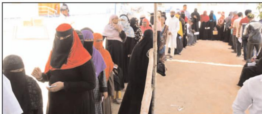
కమలాపురం నియోజకవర్గం చెన్నూరు ఎంపీపీ స్కూల్ పోలింగ్ కేంద్రంలో క్యూలో నిలిచిన ఓటర్లు