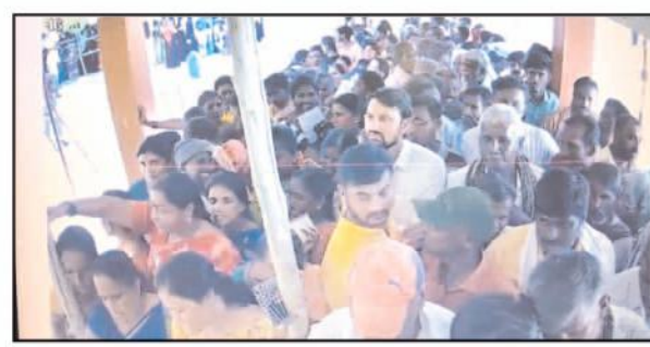
తంబళ్లపల్లె నియోజకవర్గం సోంపల్లి ఎంపీపీ స్కూల్ పోలింగ్ కేంద్రం కేంద్రంలో క్యూలో నిలిచిన ఓటర్లు