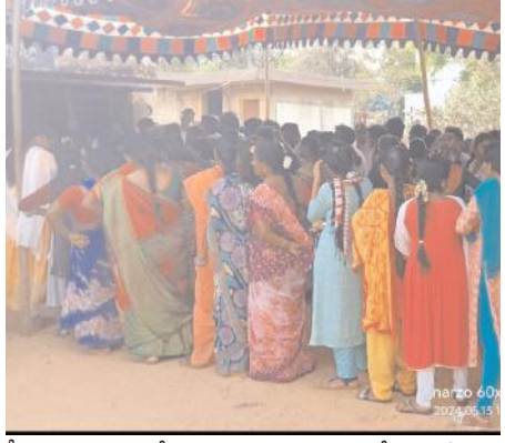
పీల్చుకున్నారు చిట్వేలి ఎన్నై తన సిబ్బందితో అన్ని పోలింగ్ కేంద్రాలను అప్రమత్తం చేస్తూ పోలింగ్ సజావుగా జరగడంలో పోలీస్ సిబ్బంది ముఖ్యభూమిక పోషించారు