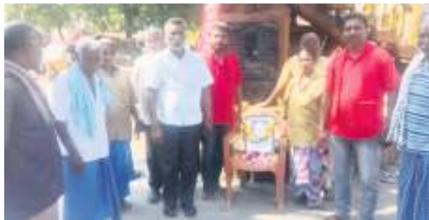
ఉన్న అట్టడుగు వర్గాల పిల్లలే మన పిల్లలుగా భావించి నా మహోన్నత మానవతవాది వ్యక్తి కామ్రేడ్ పుచ్చలపల్లి సుందరయ్య గారు. అలాగే ప్రజా సమస్యలపై ఎమ్మెల్యేగా చేసిన ఎంపీగా చేసిన ఒక

బోయినపల్లి మండల కేంద్రంలో మండల సిపిఎం పార్టీ శాఖ ఆధ్వర్యంలో కామ్రేడ్ పుచ్చలపల్లి సుందరయ్య వర్గం. ఘనంగా నిర్వహించడం జరిగింది. అనంతరం పండ్ల పంపిణీ చేశారు. కామ్రేడ్ పుచ్చలపల్లి సుందరయ్య ఉమ్మడి ఆంధ్రప్రదేశ్ నెల్లూరు జిల్లాలో మే 1, 1913లో జన్మించడం జరిగింది., అలాగే తన మరణం మే 19, 1985లో మరణించడం జరిగింది. ప్రముఖ కమ్యూనిస్టు సిపిఎం పార్టీ వ్యవస్థాపక నిర్మాత తెలంగాణ రైతాంగ సాయుధ పోరాట వీరుడు, స్వాతంత్ర్య సమరయోధుడు, కమ్యూనిస్టు గాంధీగా పేరుగాంచిన సుందరయ్య తెలుగు నాటక కమ్యూనిస్టు ఉద్యమ నిర్మాతలలో ప్రముఖుడు. ఈ దేశంలో కుల వ్యవస్థను గట్టిగా వ్యతిరేకించిన వ్యక్తి. అసలు పేరు పుచ్చలపల్లి సుందర రామిరెడ్డి. కానీ కమ్యూనిస్టు పార్టీ సిద్ధాంతంలో భాగంగా పెద్ద భూస్వామి అగ్రకులంలో పుట్టిన కూడా సాధారణంగా, నిరాదంబరంగా సిద్ధాంతంలో భాగంగా తన పేరులో ఉన్న చివర రెడ్డి అనే పదాన్ని తీసేసి సాధారణంగా పుచ్చలపల్లి సుందరయ్య గా