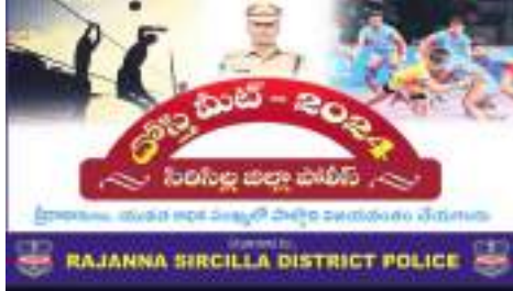
ఈ పోటీలో నిర్వహిస్తున్నట్లు ఆయన వెల్లడించారు. జిల్లా పరిధిలోని వివిధ మండలాలకు చెందిన కబడ్డీ, వాలీబాల్ క్రీడాకారులు తమ జట్ల వివరాల