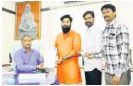
మంది బరిలో ఉండేది తేలనుంది. మొత్తానికి అంచనాలకు మించి అర్బన్ బ్యాంకు పాలకవర్గ

సిరిసిల్ల సహకార అర్బన్ బ్యాంకు పాలకవర్గ ఎన్నికల్లో భాగంగా నామినేషన్ల ప్రక్రియ బుధవారం ముగిసింది. మూడు రోజుల పాటు కొనసాగిన నామినేషన్ల పర్వంలో చివరి రోజు భారీగా నామినేషన్లు దాఖలు అయ్యాయి. 12 డివిజన్లకు గాను చివరి రోజు 62 నామినేషన్లు దాఖలు అయ్యాయి. గురువారం నామినేషన్ల ప్రూటీని, శుక్రవారం ఉపసంహరణ జరగనుంది. ఈ నెల 31న నామినేషన్ల ఉపసంహరణ అనంతరం ఎంత