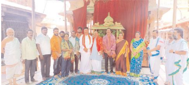
మహానంది క్షేత్రంలో కమిటీలో ఆలయ అధికారులు