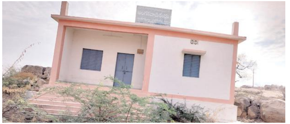
ప్రారంభానికి నోచుకోని అంగన్వాడి భవనం

సౌకర్యాలు లేకపోవడం వలన పిల్లలు ఇబ్బందులు ఎదుర్కొంటున్నట్లు పిల్లల తల్లిదండ్రులు ఆరోపించారు. రూ.12లక్షలతో అంగన్వాడి భవనం నిర్మించి సంవత్సరాలు గడుస్తున్నా, ప్రారంభానికి నోచుకోవడంతో ముఖ్యకంపలు పెరిగి చెత్తచెదారంతో పేరుకుపోయాయి. అంగన్వాడి కేంద్రం పూర్తయినా