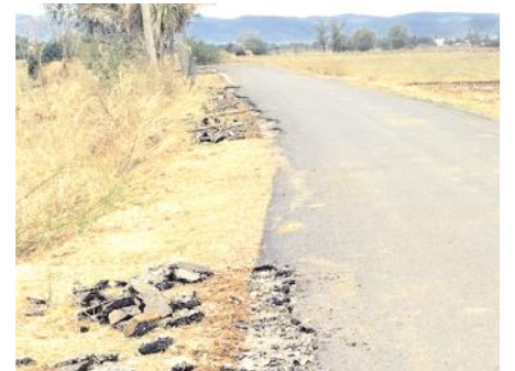
రోడ్లను త్రవ్విన దృశ్యం

వరకు లక్షలాది రూపాయలు వెచ్చించి బిటి రోడ్లు నిర్మాణం చేపట్టారు. అయితే ఈ బిటి రోడ్లు మూన్నాళ్ల ముచ్చటగా మారింది. 12 నెలలు కాకముందే రోడ్లకు ఇరువైపులా పగుళ్లు వచ్చాయి. దీంతో సంబంధిత కాంట్రాక్టర్ బిల్లు కోసం రోడ్లకు ఇరువైపులా బిటి రోడ్ల పగుళ్లు ఇచ్చిన చోట త్రవ్వి మరమ్మత్తులు చేపట్టడం