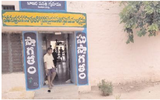
నిర్మించి 42 ఏళ్ళ అయినా మరమ్మత్తుకు నోచుకోక శిథిలావస్థకు చేరుకున్న హాస్టల్ ఇదే