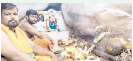
మల్లేశ్వరస్వామికి పూజలు చేస్తున్న అర్చకులు

హాళగుండ, మేజర్ న్యూస్ : హాళగుండ మండలం దేవరగట్టు మాళమల్లేశ్వర స్వామికి ఆదివారం భక్తులు విశేషంగా పూజలు చేశారు. ఉదయాన్నే ఆలయ అర్చకులు స్వామి వారికి రుద్రాభిషేకం, బిల్వార్చన, పుష్పార్చన, మహామంగళారతి పూజలు చేశారు. మాళమల్లేశ్వర దేవికి కుంకుమ,బండారు అర్చన పూజలు చేశారు. భక్తులు మండలం నుండి కాకుండా కర్ణాటక ప్రాంతాల నుండి వచ్చారు. స్వామి వారికి అమ్మ వారికి ప్రత్యేకంగా పజలు చేయించారు. ధైవదర్శనం చేసుకున్నారు. మోక్కుబడులు తీర్చుకున్నారు. పచ్చిన భక్తులకు అర్చకులు తీర్థప్రసాదాలు అందించారు. దేవాలయంలో భక్తుల సందడి నెలకొంది.