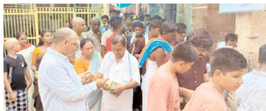
ఉచిత ప్రసాద వితరణ దృశ్యం

మహానంది, మేజర్ న్యూస్ : మహానంది పుణ్యక్షేత్రంలో భక్తుల రద్దీ నిర్వహించుకొనసాగుతుంది. ఆదివారం వేలాది మంది భక్తులు శ్రీ కామేశ్వరి సమేత మహానందిశ్వర స్వామి వార్లను దర్శించుకున్నారు. పాఠశాలలకు సెలవు దినాలు, ప్రభుత్వ కార్యాలయాలకు సెలవు