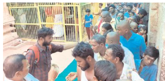
మహానంది క్షేత్రంలో స్వామి వార్ల దర్శనార్థం క్యూలైన్ లో ఉన్న భక్తులు

మహానంది, మేజర్ న్యూస్ : మహానంది పుణ్యక్షేత్రంలో భక్తుల రద్దీ నిర్వహించుకొనసాగుతుంది. ఆదివారం వేలాది మంది భక్తులు శ్రీ కామేశ్వరి సమేత మహానందిశ్వర స్వామి వార్లను దర్శించుకున్నారు. పాఠశాలలకు సెలవు దినాలు, ప్రభుత్వ కార్యాలయాలకు సెలవు