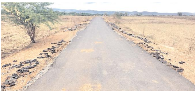
యర్రగుంట్ల గ్రామ సమీపంలో బిటి రోడ్లకు ఇరువైపులా త్రవ్విన దృశ్యం

బండిఆత్మకూరు, మేజర్ న్యూస్ : రాష్ట్ర ప్రభుత్వం పల్లెలను అనుసంధానం చేస్తూ ప్రజల సౌకర్యార్థం లక్షలాది రూపాయలు వెచ్చించి బిటి రోడ్లను నిర్మించడం జరుగుతుంది. అయితే అధికారులు మామూళ్ల కారణంగా సంబంధిత కాంట్రాక్టర్లు, నాణ్యతకు నామాలు పెడుతూ ఇష్టారాజ్యంగా రోడ్ల నిర్మాణాలు చేపడుతున్నారు. అధికారులు పర్యవేక్షణ చేస్తారు, పరిశీలిస్తారు. అయితే మామూళ్లు తీసుకోకపోతే నాణ్యత ఎందుకు లోపిస్తుంది? అన్న ప్రశ్నలు ప్రజల్లో ఎక్కువగా వినిపిస్తున్నాయి. వివరాల్లోకి వెళ్లితే బండిఆత్మకూరు మండలంలోని పార్వపల్లె గ్రామం నుంచి కాకనూరు గ్రామం మీదుగా యర్రగుంట్ల గ్రామం