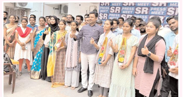
విజయ సంతోషం చూపిస్తున్న దృశ్యం