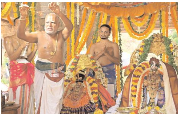
స్వామి అమ్మవార్ల కళ్యాణ మహోత్సవం నిర్వహిస్తున్న దృశ్యం

ఆళ్లగడ్డ, మేజర్ న్యూస్ : ప్రముఖ వైష్ణవ క్షేత్రమైన అహోబిలం శ్రీ లక్ష్మీనర సింహస్వామి సన్నిధిలో ఆదివారం శ్రీ చెంచులక్ష్మీ సమేతశ్రీజ్వాల నరసింహ స్వామి వసంతిక పరిణయోత్సవం వైభవంగా జరిగింది. ఎగువ అహోబి లంలో వైశాఖమాస నరసింహ జయంతి బ్రహ్మోత్సవాలు జరుగుతున్నాయి. అందులో భాగంగా ఆదివారం ఉత్సవమూర్తులైన శ్రీ జ్వాల నరసింహ స్వామి శ్రీదేవి భూదేవి అమ్మవార్లకు పంచామృతాభిషేకం నిర్వహించారు. మిగతా రిలే!