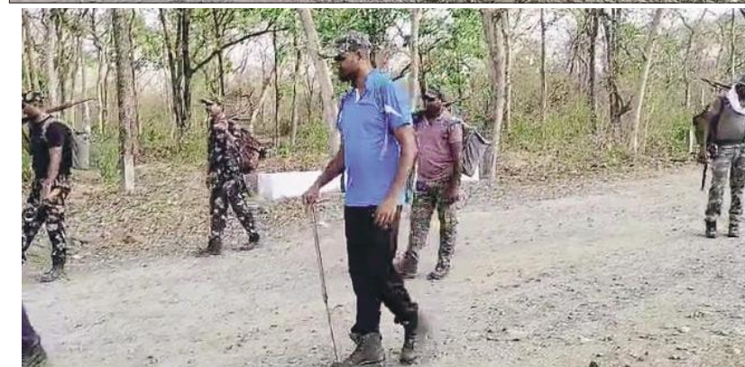
గ్రామాలలో ఉన్న సిఆర్పిఎఫ్ క్యాంపులకు అదనపు బలగాలు కూడా చేరుకున్నాయి. ఏదేమైనా ఎటువంటి అవాంఛనీయ సంఘటనలు జరగకుండా ఈ