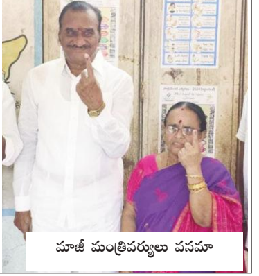
మాజీ మంత్రివర్యులు వనమా