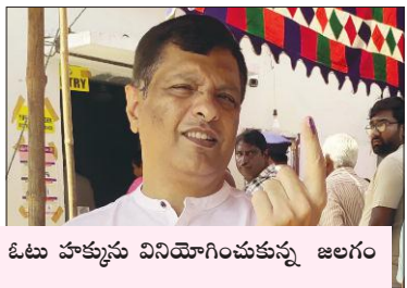
ఓటు హక్కును వినియోగించుకున్న జలగం