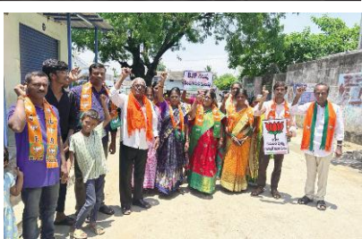
సమాచారాన్ని అందించారు. ప్రచారం చేసిన వారిలో

ఇల్లందు, సూర్య (మేజర్ న్యూస్) - సోమవారం జరిగిన మహబూబాబాద్ పార్లమెంట్ ఎన్నికల పోలింగ్ స్టేషన్ల దగ్గర కాంగ్రెస్, టీఆర్ఎస్, బిజెపి అభ్యర్థుల తరఫున ఆయా పార్టీలకు చెందిన కార్యకర్తలు, నాయకులు ప్రచారాలు నిర్వహించారు. ఓటు వేయడానికి వెళ్తున్న ఓటర్లకు శుభాకాంక్షలు తెలియజేస్తూ తమ పార్టీ అభ్యర్థికి ఓటు వేయాలని అభ్యర్థించారు. ఈ సందర్భంగా వారు పోలింగ్ స్టేషన్లు వంద మీటర్ల దూరంలో ఏర్పాటు చేసుకున్న పాపియానాలలో కూర్చుని ఓటర్లకు కావలసిన