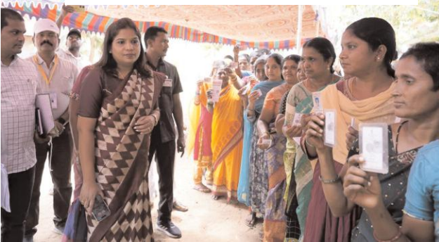
పరిశీలించిన అడిగి తెలుసుకుంటున్న జిల్లా ఎస్పీ