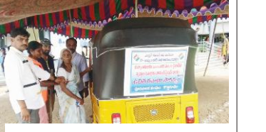
-వృద్ధులకు, వికలాంగులకు ఓటు వేసేందుకు ఏర్పాటు చేసిన ఆటో

పరిధిలోని వలు బాతులు సందర్శించి పోలింగ్ సరళిని పరిశీలించారు. కమ్యూనిస్టు, కాంగ్రెస్ కలయికను ఆదరించి ఓట్లు వేసిన ప్రజలకు, కార్యకర్తలకు అభినందనలు తెలిపారు.