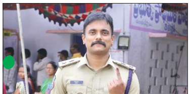
ఓటు హక్కును వినియోగించుకున్న జిల్లా ఎస్సీ