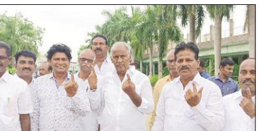
కొత్తగూడెం ఎమ్మెల్యే కూననేని