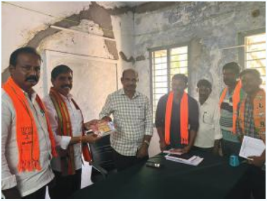
బోసకల్, సూర్య (మేజర్ స్యూస్):