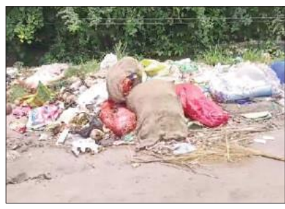
ఉండలేని పరిస్థితి ఉన్నది కాబట్టి మున్సిపాలిటీ కమిషనర్ మున్సిపల్ చైర్ పర్సన్ స్థానిక ఎమ్మెల్యే