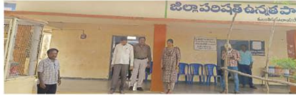
తిరుమలాయపాలెం, సూర్య మేజర్ న్యూస్ :- ఖమ్మం, నల్లగొండ, వరంగల్ జిల్లాల పట్టభద్రుల ఎమ్మెల్సీ ఉప ఎన్నికల పోలింగ్ కు సర్వే

సిద్ధమైంది. సోమవారం ఉదయం 8 గంటల నుంచి సాయంత్రం 4 గంటల వరకు పోలింగ్ జరగనుంది. ఈ నేపథ్యంలో ఎన్నికలకు సంబంధించి పోలింగ్ ఏర్పాట్లను అధికారులు చూస్తున్నారు. పోలింగ్ కేంద్రాలని కి అన్ని రకాల పోలింగ్ సామాగ్రి తా పోలింగ్ సిబ్బంది చేరుకున్నారు. పోలింగ్ కేంద్రాలలో కి వచ్చిన ప్రభుత్వ ఎన్నికల సిబ్బందికి అన్ని రకాల వసతులతో ఏర్పాట్లు ఓటర్లు క్యూ పద్ధతి లో వెళ్లేందుకు