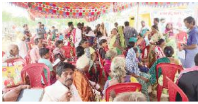
రోగులు భారీ సంఖ్యలో తరలివచ్చి చికిత్సలు తీసుకున్నారు. మెరుగైన వైద్య చికిత్స కోసం సూచనలు, సలహాలు చేశారు. చికిత్స కోసం వచ్చిన రోగుల సందేహాలను నివృత్తి చేస్తూ ఆరోగ్య జాగ్రత్తలను తెలియజేశారు. అనంతరం ఉచితంగా మందులను పంపిణీ చేశారు. శిబిరానికి వచ్చిన రోగులతో ప్రాంగణమంతా నిండి పోయింది.