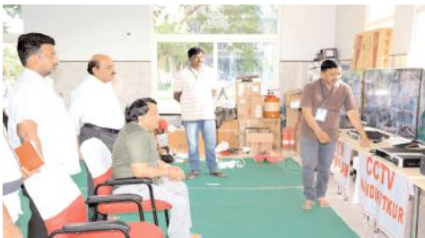
కౌంటింగ్ కేంద్రాలను పరిశీలిస్తున్న కలెక్టర్

నంద్యాల అర్బన్, మేజర్ న్యూస్: జూన్ 4వ తేదీన నిర్వహించే సార్వత్రిక ఎన్నికల ఓట్ల లెక్కింపు కేంద్రాలలో ఏర్పాట్లు వేగవంతంగా పూర్తి చేయాలని జిల్లా ఎన్నికల అధికారి, కలెక్టర్ డా.శ్రీనివాసులు అధికారులను ఆదేశించారు. కలెక్టర్ మాట్లాడుతూ ఓట్ల లెక్కింపు ప్రక్రియకు అవసరమైన ఏర్పాట్లు వేగవంతంగా పూర్తి చేయాలని ఆర్ఆండ్బీ ఎస్ఈ శ్రీధర్ రెడ్డిని ఆదేశించారు. కమాండ్ కంట్రోల్ రూంను సందర్శించి సీసీ కెమెరాలతో కౌంటింగ్ కేంద్రాల వెబ్ క్యాన్సెస్ పరిశీలిస్తూ నిరంతరం నిఘా ఉండాలని సిబ్బందికి ఆదేశించారు. ఎలాంటి అవాంఛనీయ సంఘటనలు జరుగకుండా కట్టుదిట్టమైన భద్రతా చర్యలు తీసుకోవాలన్నారు. కౌంటింగ్ సెంటర్ వద్ద 144 సెక్షన్ అమలులో ఉన్నందు అభ్యర్థులు, ఏజెంట్లు మినహా ఇతరులను కౌంటింగ్ వద్దకు అనుమతించకుండా కట్టుదిట్టమైన చర్యలు తీసుకోవాలన్నారు. ప్రతి నియోజకవర్గానికి ఏర్పాటు చేసిన కౌంటింగ్ సెంటరులో అన్ని ఏర్పాట్లు పూర్తి చేయాలన్నారు.