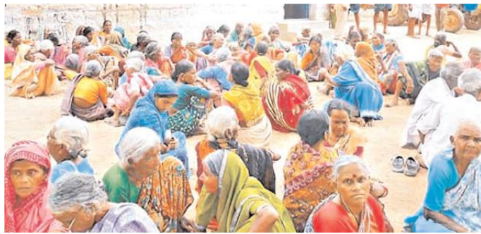
పింఛన్ దారుల (ఫ్రీటోటో)

పింఛన్ దారుల ఇళ్ళ వద్దకే వెళ్లి పింఛన్ అందజేయబోతున్నారు. అనారోగ్య కారణాల దృష్ట్యా, వృద్ధులు, వికలాంగులకు వెల్ఫేర్ అధికారులు పింఛన్ అందజేస్తారని మండల అధికారులు తెలిపారు. మిగిలిన పింఛన్ దారులకు వారి ఖాతాలలో పింఛన్ అందజేస్తారని తెలిపారు.