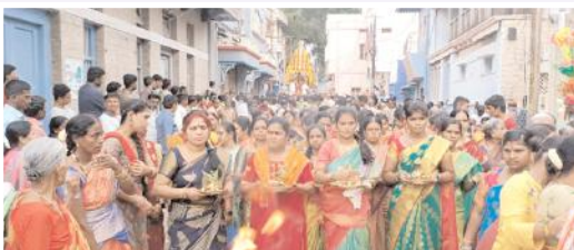
రథోత్సవం వద్ద కలశాలతో మహిళలు

ఆదోని, మేజర్ న్యూస్ : ఆదోని పట్టణంలో వెలసిన లక్ష్మమ్మవ్వ జాతర అంగరంగ వైభవంగా నిర్వహించారు. గురువారం అమ్మవారి 92వ రథోత్సవం సందర్భంగా అమ్మవారిని ప్రత్యేక పూలతో అలంకరించి కుంకుమార్చన, మహామంగళహారతి వంటి వేద పండితుల ఆధ్వర్యంలో ప్రత్యేక పూజలు నిర్వహించారు. అవ్వ రథోత్సవం కనులారా తిలకించేందుకు వెయ్యి కళ్లతో పేజీ 6లో