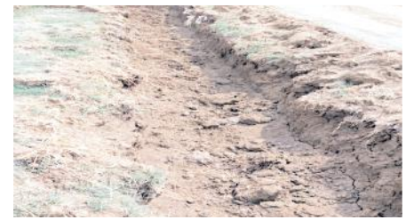
దేవదాయ భూముల్లో లోతుగా తవ్విన దృశ్యం