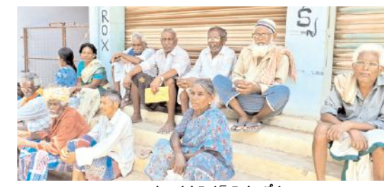
బ్యాంకుల వద్ద పెన్షన్ పైకం కోసం వడిగావులు కాస్తున్న పెన్షనీదారులు (ఫైల్ ఫోటో)

చాగలమర్రి, మేజర్ న్యూస్ : ఆంధ్రప్రదేశ్లో ఎన్నికల కోడ్ ప్రకటించిన తరుణంలో వాలంటీర్లు విధులకు దూరంగా వుండాలని ఎన్నికల కమిషన్ సూచించింది. ఆ కారణంగా ఏప్రియల్ నెల ఇవ్వవలసిన వృద్ధాప్య, వితంతు, దివ్యాంగుల ఫింఛన్ నేరుగా ఇంటివద్ద కాకుండా సచివాలయంలో పంపిణీ చేశారు. మే నెలలో కారణం ఏమైనప్పటికీ ఫింఛన్ దారుల బ్యాంకు ఖాతాలలో జమ చేశారు. చాలామంది లబ్ధిదారులకు మనుగడలో లేని బ్యాంకు ఖాతాలలో జమ చేయడం వలన ఫింఛన్ సొమ్ము గత నెల చాలా మంది అవ్వ, తాతలకు అందక పోగా ఆ నెల అవ్వ తాతలకు అన్నము లేక అలమటించారు. మరి ఈ నెలలో ఏ విధంగా ఫింఛన్ సొమ్ము అందిస్తారో సని అవ్వ తాతలు ఆందోళన చెందుతున్నారు. ఈ నెల అయినా పెన్షన్ మా చేతికి వచ్చి కష్టాలు తీరుతాయని విచారం వ్యక్తం చేస్తున్నారు. సంబంధిత అధికారులు చొరవ తీసుకుని తమ ఫింఛన్ సొమ్మును ఇంటివద్దకు అందించాలని, కనీసం సచివాలయం పరిధిలో నేరుగా అందించాలని కోరుకుంటున్నారు. గత నెల మాదిరిగా మనుగడలో లేని బ్యాంకు ఖాతాలలో జమ చేసిన యెడల ఈ నెల ఫింఛన్ సొమ్ముకు నోచుకోమని తమ ఆవేదనను అర్థం చేసుకుని ఫింఛన్ సొమ్ము