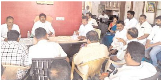
సమావేశంలో మాట్లాడుతున్న డిప్యూటీ కమిషనర్