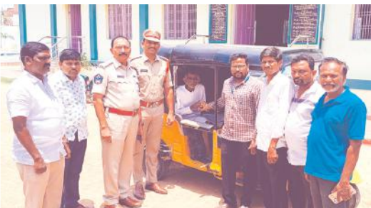
సభ్యులను అభినందిస్తున్న డిఎస్పి, సిఐ, దాతలు