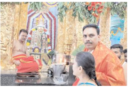
అవ్వకు పూజలు చేస్తున్న డిఎస్పి