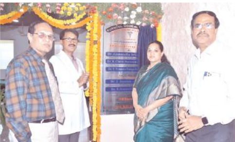
గారికి ఆర్థి సమర్పించారు. అనంతరం జిల్లా కలెక్టర్