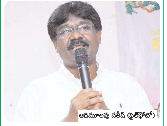
ఆదిమాలపు సతీష్ (ఫ్రెల్ ఫోటో)