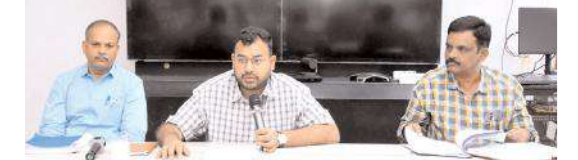
అవగాహన కల్పిస్తున్న రిటర్నింగ్ అధికారి భార్యవతేజ

కర్నూలు నగరం, మేజర్ న్యూస్: 2024 సార్వత్రిక ఎన్నికల్లో భాగంగా 137 కర్నూలు అసెంబ్లీ నియోజకవర్గ ఎన్నికల్లో పోటీ చేస్తున్న అభ్యర్థులు తమ తరపున పోలింగ్ ఏజెంట్లు నియమించుకుంటున్న ఏజెంట్ల వివరాలను ఈ నెల 12వ తేదీన ఇవ్వాలని కర్నూలు నియోజకవర్గ రిటర్నింగ్ అధికారి భార్యవతేజ తెలిపారు. గురువారం నగరంలోని మున్సిపల్ కౌన్సిల్ హాల్ లో కర్నూలు అసెంబ్లీ నియోజకవర్గ ఎన్నికల్లో పోటీ చేస్తున్న అభ్యర్థులతో పోలింగ్ ఏజెంట్ల నియామకంపై అవగాహన సదస్సు నిర్వహించారు. ఈ సందర్భంగా ఆయన మాట్లాడుతూ ఎన్నికల్లో పోటీ చేసే అభ్యర్థులు ఫారం-10 ఉపయోగించి తమ పోలింగ్ ఏజెంట్ల గురించి నియమించుకునే వ్యక్తుల వివరాలు 12న రిటర్నింగ్ అధికారికి సమర్పించాలన్నారు. అలాగే ఒక పోలింగ్ కేంద్రానికి ఒక అభ్యర్థి గరిష్టంగా ముగ్గురు పోలింగ్ ఏజెంట్లను నియమించుకోవచ్చని, వారికి పీసీ ఎంట్రీ పాస్ నలు జారీ చేస్తారన్నారు. నియమితమైన పోలింగ్ ఏజెంట్లు 13వ తేదీ ఉదయం 5.30 గంటలకు తప్పకుండా పోలింగ్ కేంద్రంలో నిర్వహించే మాక్ పోల్ నిర్వహణకు హాజరుకావాలన్నారు. అలాగే 137 కర్నూలు అసెంబ్లీకి సంబంధించిన పోలింగ్ కేంద్రాల్లో పోలింగ్ ఏజెంట్ల గురించి నియమించదలచిన వ్యక్తులు ఖచ్చితంగా 137 అసెంబ్లీ నియోజకవర్గ