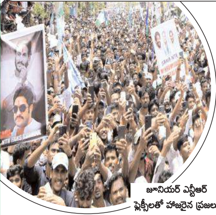
జానియర్ ఎన్టీఆర్ ఫ్లెక్సీలతో హాజరైన ప్రజలు