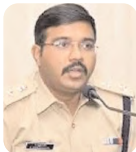
ఎస్సీ కృష్ణకాంత్ (ఫ్రెల్ ఫోటో)