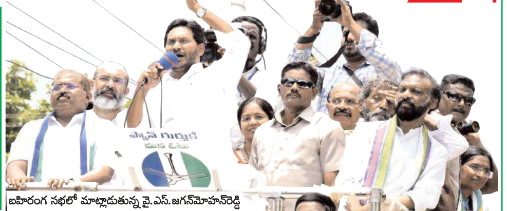
బహిరంగ సభలో మాట్లాడుతున్న వై.ఎస్.జగన్మోహన్ రెడ్డి