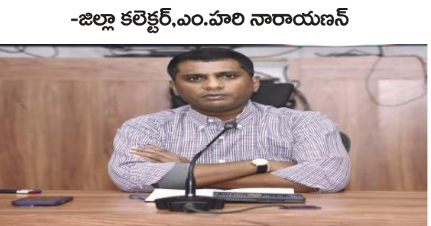
-జిల్లా కలెక్టర్,ఎం.హరి నారాయణన్ నెల్లూరు కలెక్టరేట్ (మేజర్ న్యూస్)జిల్లాలోఎన్నికల తర్వాత రాజకీయ ఘర్షణలు, అల్లర్లు తలెత్తకుండా ముందస్తు చర్యలు తీసుకోవాలని జిల్లా కలెక్టర్ ఎం. హరి నారాయణన్ రిటర్నింగ్ అధికారులను మిగతా 2లో