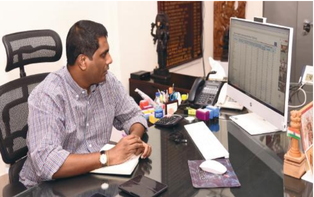
తాగునీటి కొరత లేకుండా చర్యలు తీసుకోవాలి