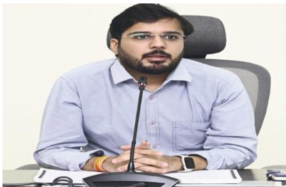
-రిటర్నింగ్ అధికారి వికాస్ మర్కట్, ఐ.ఏ.ఎస్.,

నెల్లూరు కార్పొరేషన్ (మేజర్ న్యూస్ )సార్వత్రిక ఎన్నికల కౌంటింగ్ నిర్వహణ ప్రక్రియను ప్రణాళికాబద్ధంగా నిర్వహించేలా అన్ని ముందస్తు ఏర్పాట్లను పర్యవేక్షిస్తున్నామని 117 - నెల్లూరు సీటీ నియోజకవర్గం రిటర్నింగ్ అధికారి వికాస్ మర్కట్, ఐ.ఏ.ఎస్., తెలిపారు. ఎన్నికల సంఘం, జిల్లా ఎన్నికల అధికారి ఆదేశాల మేరకు వివిధ రాజకీయ పార్టీల ప్రతినిధులతో కౌంటింగ్ నిర్వహణపై సమావేశాన్ని కార్పొరేషన్ కమాండ్ కంట్రోల్ సెంటర్ విభాగంలో బుధవారం నిర్వహించారు. ఈ సందర్భంగా ఆర్.ఓ మాట్లాడుతూ జూన్ నెల 4వ తేదీన ఉదయం 8 గంటలనుంచి ప్రారంభమయ్యే కౌంటింగ్ ప్రక్రియలో మొదటిగా పోస్టల్ బ్యాలెట్ల లెక్కింపు చేపట్టనున్నామని తెలిపారు. అనంతరం 8.30 గంటలనుంచి ఈవీఎంల లెక్కింపు ప్రారంభమవుతుందని తెలిపారు. ఎన్నికల సిబ్బంది అందరూ అన్ని విభాగాలను సమన్వయం చేసుకుంటూ కౌంటింగ్ ప్రక్రియలో పాల్గొనాలని ఆదేశించారు. పోస్టల్ బ్యాలెట్, హోమ్