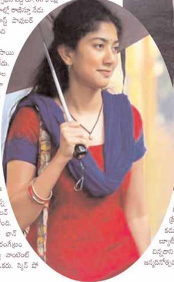
చేయదు... రొమాంటిక్ సీన్స్ లో నటించదు.మరీ పొల్లి బట్టలు వేసుకోదు..అయినా సరే సాయి పల్లవి క్రేజ్ మాత్రం ఓరేండ్ లో ఉంటుంది. ఆమె కోసం క్యూ కదుతుంటారు మేకర్స్.. లాల్ పుడ్ లో మోస్ట్ వాంటెడ్ బ్యూటీ ఈ భామ. అద్భుత నటన, ఆకట్టుకునే రూపం ఈ చిన్నదాని సొంతం ఒక్కటి ఏస్.. హైలీడ్ సిల్ల, సాయి పల్లవి జన్మదినోత్సవ కుభాశాంక్షలు