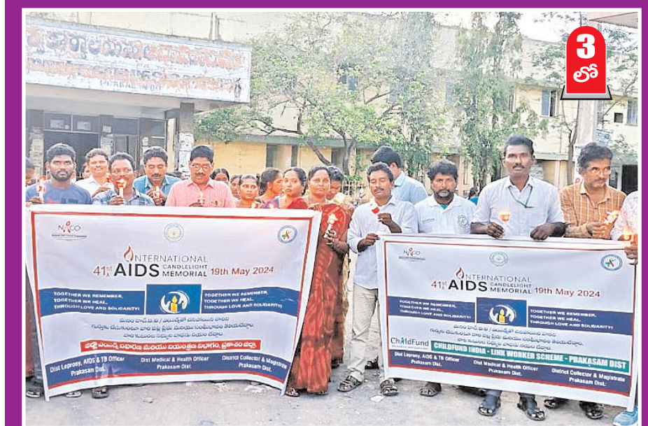
ఎయిడ్స్ బాధితుల పట్ల వివక్షత చూపాద్దు 3 లో