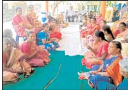
య స్వామి వారికి పూజారి అగ్నిహోత్రం అప్పలా చారులూ ఆధ్వర్యంలో వైశాఖ మాసం సందర్భంగా శుద్ధ త్రయోదశి మంగళవారం ఏకాదశపర్వంతం మన్యు సూక్త పారాయణ సహితముగా సింధూరార్చన, లక్ష మల్లేలార్చన, నాగవల్లి దళములతో (తమల పాకులతో) పూజ కార్యక్రమము అత్యంత వైభవముగా నిర్వహించారు. శ్రీ ప్రసన్నాంజనేయ స్వామి వారి స్వామివారి అభిషేక కార్యక్రమము, పూజా కార్యక్రమంలో పాల్గొన్న ప్రతి ఒక్కరికి స్వామివారి ప్రసాదంగా సింధూరము, స్వామివారి రక్తలు, స్వామివారి రూపులు, ప్రసాదంగా అందించారు. ఈ కర్లపాలెం పూజారులు, ఆలయ కమిటీ సభ్యులు, గ్రామ పెద్దలు, భక్తులు పాల్గొన్నారు.