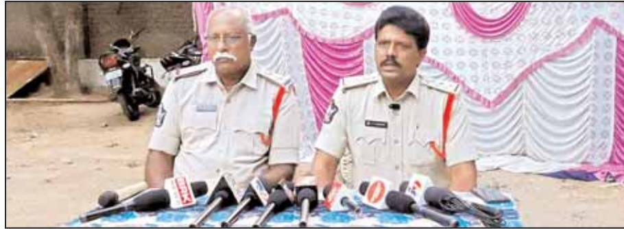
పెట్రోల్ బంకు నిర్వాహకులకు నోటీసులు ఇచ్చామని పోస్టులు పెడితే వారిపై కఠిన చర్యలు తెలిపారు. అలాగే సోషల్ మీడియాలో కూడా రెచ్చగొట్టే తీసుకుంటామని ఆయన హెచ్చరించారు.