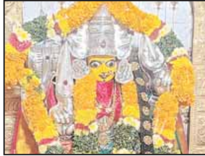
కార్యక్రమాలు ఏర్పాటు చేయ బ డతాయన్నారు. ఈ రెండు రోజుల కార్యక్రమాలలో భక్తులు అధిక సంఖ్యలో పాల్గొని అమ్మవారి కృపాకటాక్షాలకు పాత్రులు కావాల్సిందిగా దేవస్థాన ఉత్సవ కాపు సంఘ కమిటీ సభ్యులు కోరారు.

భట్టిప్రోలు, మేజర్ న్యూస్: మండల కేంద్రమైన భట్టిప్రోలులో ని రుద్ర భూమిలో వెలసియున్న శ్రీ గుండీ పార్వతి అమ్మవారి దేవాలయ నిర్మాణ పదవ వార్షికోత్సవం బుధ, గురువు వారాలలో జరుగుతాయని శ్రీ గుండీ పార్వతి అమ్మవారి సేవాకాపు సంఘం సభ్యులు మంగళవారం తెలిపారు. ఈ సందర్భంగా వారు మాట్లాడుతూ బుధవారం ఉదయం అమ్మవారికి అభిషేకాలు, ప్రత్యేక పూజలు నిర్వహించిన అనంతరం కుంకుమ పూజ జరుగుతుందన్నారు. మధ్యాహ్నం 11 లకు అమ్మవారికి మొక్కుబడులు, పసుపు బళ్ల ఊరేగింపు పురవిధులలో నిర్వహిస్తారన్నారు. గురువారం ఉదయం అమ్మవారికి సద్ది వైవేద్యాలు, పసుపు బండ్లతో గ్రామోత్సవం, సాయంత్రం విద్యుత్ దీపాలతో అలంకరించిన ప్రభలు గుడి దగ్గర సాంస్కృతిక