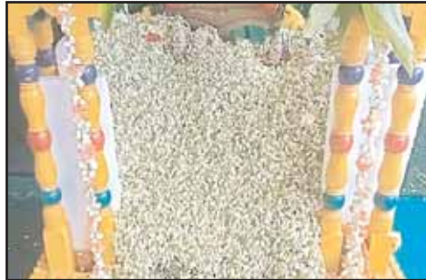
కర్లపాలెం, మేజర్ న్యూస్: కర్లపాలెం మండలం కొత్తరాజులపాలెం (యేట్రవారిపాలెం) గ్రామంలో వేంచేసి ఉన్న శ్రీ కోండారామ స్వామి వారి దేవాలయంలో కొలువుతీరి ఉన్న శ్రీ సువర్చల సమేత ప్రసన్నాంజనేయ