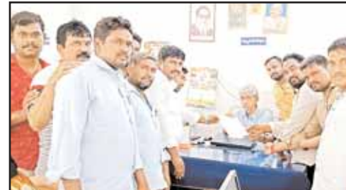
మా ఇబ్బందిని గుర్తించమని ప్రతిరోజు ఎమ్మార్వో ఆఫీస్ చుట్టూ ప్రదర్శనలు చేస్తున్న మా మీద చిన్న చూపు చూస్తూ కాలయాపన చేస్తున్నారు. ఇప్పటికైనా మాకు తగిన న్యాయం చేసి మాకు రావాల్సిన పైకెక్కు కలెక్టర్ ఆర్డర్ ప్రకారం షిఫ్ట్ వారి విధులు నిర్వహించిన వీడియో గ్రాఫర్లకు 2100 రూపాయలు, రోజు వారి విధులు నిర్వహించిన వీడియో గ్రాఫర్లకు 3000 రూపాయలు చొప్పున చెల్లించాలని డిమాండ్ తాసిల్దార్ కి వినతి పత్రం సమర్పించడం చేశాము. వారు తగిన న్యాయం చేస్తామని చెప్పారు.

గిద్దలూరు, మేజర్ న్యూస్: నియోజకవర్గం 2024 అసెంబ్లీ ఎన్నికల విధులకు వీడియో చిత్రీకరణచేయడానికి మమ్ములను పిలిచి విధులు నిర్వహించవలసిందిగా కోరారు. గత 56 రోజులు మేము కష్టపడి వీడియో చిత్రీకరణ నిర్వహించడం జరిగింది. దీనికి సంబంధించిన వేతనం మాకు చెల్లించమని కోరగా జాప్యం చేయడంతో పాటు మాకు సాధారణ కాల వేతనం 2100 ఇస్తామని కలెక్టర్ ఆదేశాలు ఉన్నాయి. కానీ ఇక్కడ ఆఫీసు వాళ్ళు మూడు షిఫ్ట్ ప్రకారం మీకు ఇస్తామని చెప్పారని రోజుకు 1000 రూపాయలు లాగా పెంచామని చెప్పారు. మేము ఉద్యోగస్తులం కాదు మాకు ఈ వృత్తి మీదే జీవనాధారంగా ఎంచుకొని ఉన్నాము. ఎన్నికల విధుల్లో మాకు ట్రావెలింగ్ ఖర్చులు, భోజన ఖర్చులు మా సొంత డబ్బులు వెచ్చించి సీజన్లో పెళ్లి ప్రోగ్రాములు కూడా వదులుకొని ఎలక్షన్ కార్యక్రమంలో పాల్గొని ఎక్కడ ఏ విఘటనలు జరగకుండా చూసే పనిని మాకు అప్పగించారు 56 రోజులు మేము చేసిన పనికి వేతనమూర్తకు ఇవ్వమని అడగక ఇంకా రాలేదని రోజు అలానే చెప్పుకుంటూ కాలం వెళ్ళుచున్నాం. ఎన్నికలు కూడా అయిపోయాయి ఇప్పటికైనా