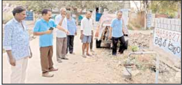
శ్రామికుడిగా మారి సమస్యను పరిష్కరించే వరకు నిద్రపోని బాధ్యత గల ఉద్యోగి.. ఉద్యోగ బాధ్యతలు చేపట్టిన అతి కొద్ది సమయంలోనే నగర