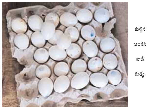
అధికారుల నిద్రమత్తు కూడా ఇందుకు తోడవుతోంది. గత 15 రోజుల క్రితం గర్బిణీలకు కుళ్ళిన కోడిగుడ్లను ఐసిడిఎస్ నిబ్బంది పంపిణీ చేశారు.

★ అక్రమాలకు చెక్ కే...ప్రభుత్వ లోగో... అక్రమాలకు చెక్ పెట్టేందుకు ప్రభుత్వ లోగో తో సరఫరా చేసేందుకు ఏర్పాట్లు చేసిన, కాంట్రాక్టర్లు మాత్రం కుళ్ళిన అతి చిన్న సైబి గుడ్లను లోగో తో సరఫరా చేస్తున్నారు. ఇటీవల వికారాబాద్ జిల్లా నవాబ్ పేట్ మండలం ఎల్లకొండ తదితర కొన్ని అంగన్ వాడీ కేంద్రాలకు గత నెల వచ్చిన నాసిరకం, కుళ్ళిన చిన్న కోడిగుడ్లను కాంట్రాక్టర్లు సరఫరా చేశారు. వాటిని అంగన్వాడీ నిర్వాహకులు గర్బిణీలకు ఇచ్చారు. ★ ఈ గుడ్లు ఎలా తినాలి...? అంగన్ వాడీ కేంద్రంలో గుడ్లను తీసుకున్న కొందరు గర్బిణీలు, బాలింతలు ఇంటికి తీసుకెళ్ళి ఉడకబెట్టగా దుర్వాసన రావడంతో వాటిని పారవేశారు.కొందరు తిరిగి అంగన్ వాడీ కేంద్రంలో ఇచ్చారు.గర్బిణీలు, బాలింతలు కొందరు ఈ కుళ్ళిన గుడ్లు మాకు ఎందుకు...? ఎలా తినాలి మీరు ఇవ్వే తింటారా...?మాకు ఎం అయినా అయితే భాధ్యులు ఎవ్వరు అని నిలదీస్తున్నారు. ఇకనైనా అధికారులు తమ సీట్లకే పరిమితం కాకుండా అంగన్వాడీ నింట్లను తనిఖీలు చేయాలని పలువురు గర్బిణీలు, బాలింతలు విజ్ఞప్తి చేశారు.