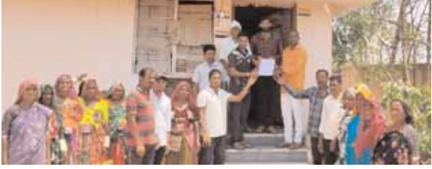
పిఎస్ పిఎస్ ఆధ్వర్యంలో ఏకాకి వినతిపత్రం అందిస్తున్న గిరిజనులు.