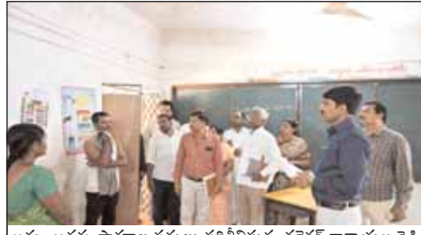
అమ్మ ఆదర్శ పాఠశాల పనులు పరిశీలిస్తున్న కలెక్టర్ నారాయణ రెడ్డి.

▶▶ ఏకరూప దుస్తుల తయారీలో నాణ్యత పాటించాలి ▶▶ రైతులను ఇబ్బందులకు గురి చేయకుండా వరి కొనుగోలు చేయాలి ▶▶ జిల్లా కలెక్టర్ సి.నారాయణరెడ్డి ▶▶ యాలల్ మండలంలో ఆకస్మిక తనిఖీలు చేసిన కలెక్టర్ యాలల,మేజర్ న్యూస్ (మే 22):