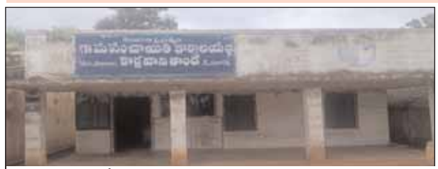
గ్రామపంచాయతీ భవనంగా ఉపయోగిస్తున్న కొర్రవాని తండా పాఠశాల

▶▶ మండలంలో 09 ప్రాథమిక పాఠశాలల మూసివేత ▶▶ గ్రామాల్లో పాఠశాలల అడ్డం గల్లంతు ▶▶ కాంగ్రెస్ ప్రభుత్వ ప్రకటనతో గ్రామాల్లో చిగురిస్తున్న ఆశలు