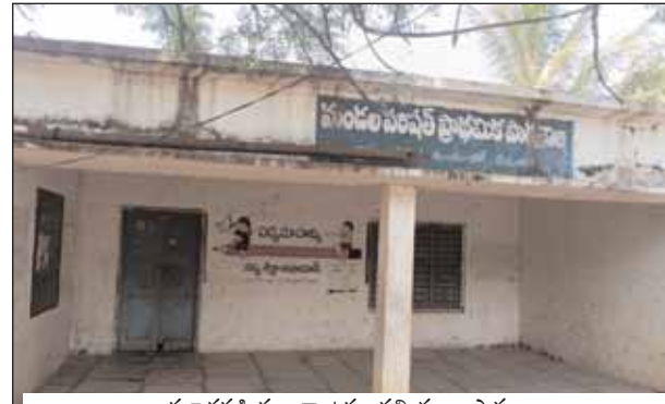
మూతపడి వృథాగా ఉన్న సత్తి తండా పాఠశాల

పాఠశాలలు ఒకప్పుడు ఉండేవని వాటి అడ్రస్లు గల్లంతు వాటిని గ్రామపంచాయతీలుగా పిలుస్తున్నారు. పాఠశాలలు మూతపడినప్పటికీ ఆయా పాఠశాలల్లోని ఉపాధ్యాయులు కొనసాగుతూ డిప్యూటీ పస్టె ఇతర పాఠశాలల్లో పనిచేస్తున్నారు. ప్రభుత్వ పాఠశాలలు మూతపడడంతో కొన్ని గ్రామాల్లోని ప్రజలు వారి పిల్లలను వ్యయప్రయాసకోర్చి ప్రైవేట్ పాఠశాలలకు పంపిస్తున్నారు. కొన్ని గ్రామాల్లో పాఠశాలలు లేక విద్యార్థులు కిలోమీటర్ల పైగా నడిచివెళ్లి చదువుకోవాల్సి వస్తుందని ఆవేధన వ్యక్తం చేస్తున్నారు. విద్యాహక్కు చట్టం ప్రకారం కిలోమీటర్ల లోపు ప్రాథమిక, మాధ్యమిక కిలోమీటర్ల లోపు ప్రాథమికోన్నత, ఐదు కిలోమీటర్ల లోపు ఉన్నత పాఠశాల ఉండాలి. ప్రస్తుతం ప్రభుత్వ పాఠశాలల్లోని ఆంగ్ల మాధ్యమంలో బోధన చేస్తున్నారు. ఇప్పటికైనా సంబంధిత అధికారులు, ఆయా గ్రామాల ప్రజాప్రతినిధులు స్పందించి తమ గ్రామాల్లోని బడిడు పిల్లలందరినీ పాఠశాలలకు పంపించే విధంగా చర్యలు తీసుకుంటే తిరిగి ఆయా గ్రామాల్లో ప్రభుత్వ పాఠశాలలకు పూర్వభ్రష్టం వస్తుందని పలువురు ఆశాభావం వ్యక్తం చేస్తున్నారు.