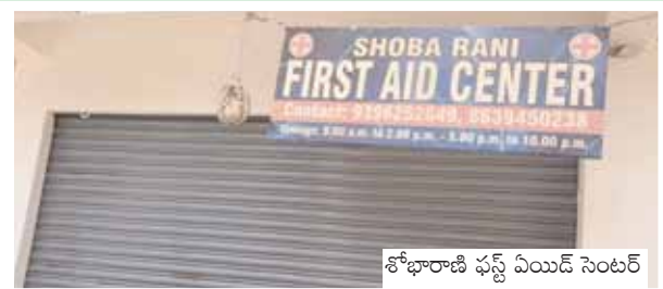
శోభారాణి ఫస్ట్ ఏయిడ్ సెంటర్