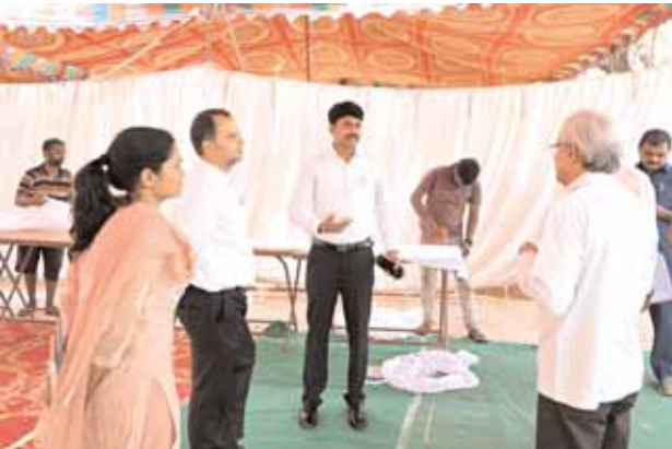
వికారాబాద్ మేరినాడ్ స్కూల్లో ఈవిఎం పంపిణీ కేంద్రాన్ని పరిశీలిస్తున్న కలెక్టర్ నారాయణ రెడ్డి.

● వికారాబాద్ జిల్లా కలెక్టర్ సి.నారాయణ రెడ్డి ● మేరినాడ్ స్కూల్లో ఈవిఎం పంపిణీ కేంద్రాన్ని పరిశీలించిన కలెక్టర్