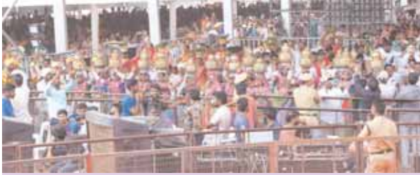
ఆకట్టుకున్న జన జాతర సభ

● సభకు హాజరైన ప్రియాంక గాంధీ, రేవంత్ రెడ్డిలు