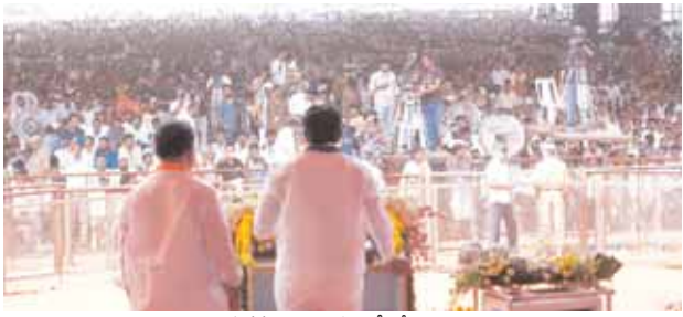
సభకు హాజరైన పార్టీ శ్రేణులు

మొదటిపేజీ తరువాయి... తమ స్వార్థం కోసం రాజ్యాంగాన్ని మార్చడానికి బీజేపీ పెద్దలు కుట్ర వస్తున్నారని, ఆ కుట్రలను పన్నగం చేస్తామని ఆమె అన్నారు. బీజేపీ పదేళ్ల పాలనలో దేశంలో పరిస్థితి అస్వస్థంగా తయారయ్యింది అని, ధనవంతులే అధిక ధనవంతులు అవుతున్నారని, నిరుద్యోగం విలయతాండవం చేస్తుందని ఆమె అన్నారు. బీజేపీ కి ఎలాంటి అవకాశం ఇచ్చిన పరిస్థితి గోరంగా అవుతుందని ఆమె అన్నారు. ప్రధాన మోదీ తమ మిత్రుల కోసం పదహారు లక్షల కోట్ల రూపాయలు రుణమాఫీ చేసారని అదే పేదల కోసం యజ్ఞి వేలు కూడా చేయడం లేదని ఆమె మండిపడ్డారు. దేశ ప్రజల మధ్యల చిచ్చు పెట్టి లబ్ధి పొందాలని బీజేపీ చుస్తున్నదని ఆమె అన్నారు. బీజేపీ పాలిస్తున్న రాష్ట్రాలలో పరిస్థితి అయోమయంగా ఉన్నదని అన్నారు. దేశ సంపదన కొందరి చేతుల్లోకి వెళ్లిందని, అందులో మీడియా సంస్థలు కూడా ఉన్నాయని అందుకూగాను ఎవరు బీజేపీ అవినీతిని బయట పెట్టడం లేదని ప్రయాంక గాంధీ ఆందోళన వ్యక్తం చేశారు. ప్రజా సంక్షేమం కోసం కాంగ్రెస్ పార్టీ ఆరాట పడుతున్నదని ఆమె పేర్కొన్నారు. ప్రజా ప్రభుత్వం ఏర్పాటు కోసం కాంగ్రెస్ పార్టీ ముందుకు సాగుతుండగా, బీజేపీ మతాల పేరిట ప్రజలను విడదీస్తున్నదని ఆమె అన్నారు. ప్రధాని మోదీ రాబోయే ఇరవై ఐదు ఏళ్ల గురించి చెప్తుంటారని, ఇప్పుడు