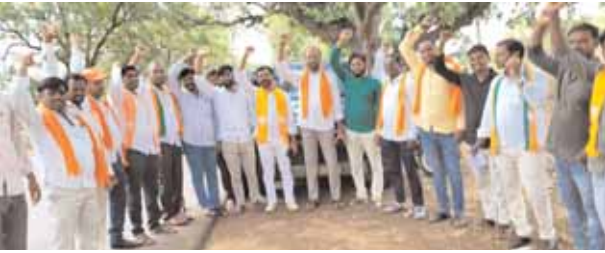
సభకు బయలుదేరిన నాయకులు