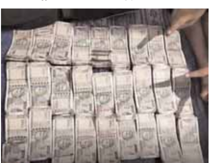
స్వాధీనం చేసుకున్న రూ. లు

కీసర, మేజర్ న్యూస్(మే, 11): వాహనాల తనిఖీలో రూ. 18.30 లక్షలు స్వాధీనం చేసుకున్న ఘటన శనివారం కీసర పోలీస్ స్టేషన్ పరిధిలో జరిగింది. పార్లమెంట్ ఎన్నికల నేపథ్యంలో కీసరలో పోలీసులు వాహనాల తనిఖీ చేశారు. తనిఖీల్లో లెక్కలు చూపని రూ.