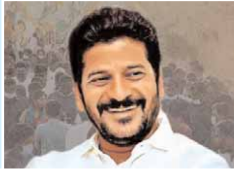
ఎనుముల రేవంత్ రెడ్డి, తెలంగాణ రాష్ట్ర ముఖ్యమంత్రి