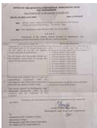
ఆర్డీబి యాక్టు కింద దొరికిన సమాచారం

వచ్చింది. కార్పొరేషన్ పరిధిలోని యాదాద్రి కాలనీలో ఓ నిర్మాణదారుడు అర ఎకరా స్థలంలో ఇండిపెండెంట్ ఇళ్ల నిర్మాణానికి అనుమతులు తీసుకున్నాడు. వాటిని విల్లాలుగా మలిచి సెమి గేటెడ్ కమ్యూనిటీ అని నామకరణం చేశాడు. దీని ద్వారా ఆ ప్రాంతంలో బహిరంగ మార్కెట్లో ఇండిపెండెంట్ నివాసం ధర రూ. 1.6 కోట్లు ఉండగా, విల్లాలుగా నిర్మించి రూ. 2.49 కోట్లకు విక్రయించి సొమ్ము చేసుకుంటున్నాడు. ఇలా చేయడం ద్వారా మొత్తం నివాసాలకు రూ. 16 కోట్లు రావాల్సి ఉండగా ఏకంగా రూ. 24 కోట్ల వ్యాపారానికి స్కెచ్ వేశాడు. సుమారు రూ. 10 కోట్ల మేర లాభాన్ని ఆర్జించేందుకు నిర్మాణదారుడు పన్నాగం పన్నాడు. ఈ పన్నాగానికి ఘనత వహించిన కార్పొరేషన్ టౌన్ ప్లానింగ్ అధికారులు సైతం పత్యాను పలుకుతున్నట్లుగా ఆరోపణలు వినిపిస్తున్నాయి. అధికంగా వచ్చిన డబ్బులను స్థానిక పేరు మోసిన ప్రజా ప్రతినిధులకు, కార్పొరేషన్ అధికారులకు భారీ మొత్తంలో ముడుపులు అందించినట్లు స్థానికులు ఆరోపిస్తున్నారు. ఈ సందర్భంగా స్థానికులు మాట్లాడుతూ.. స్థానికంగా కొనుగోళ్లు చేసే వారు అప్రమత్తంగా ఉండాలని, బిల్డర్ల మాయాజాలంలో పడి మోసపోవద్దని సూచించారు. ఈ విషయంపై మున్సిపల్ ఉన్నతాధికారులు దృష్టి సారించి భారీ అవినీతిని బట్టబయలు చేయాలని వారు కోరుతున్నారు.