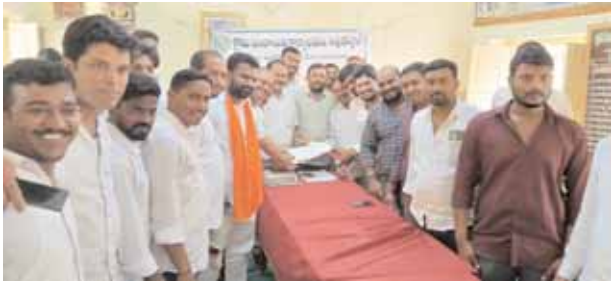
ఘట్టేసర్, మేజర్ న్యూస్(మే, 20): పార్కుస్థలం కాపాడాలని అవుశాపూర్ గ్రామస్థులు సోమవారం డిఎల్పీవో సాంబిరెడ్డికి వినతిపత్రం అందజేశారు. అవుశాపూర్ రెవెన్యూ పరిధిలోని సర్వేనెంబర్లు 253, 255, 256, 257, 261,

262, 263, 264 లో దాదాపు 70 ఎకరాల్లో 1985లో 600 ప్లాటు చేశారు. న్యూనిటీ పేరుతో మూడు సెక్టార్లలో వెంచర్ చేశారు. వెంచర్ చేసిన సమయంలో పబ్లిక్ ప్లే గ్రౌండ్ (పబ్లిక్ పార్క్) కోసం 2400 గజాల స్థలాన్ని వదిలిపెట్టారు. పంచాయతీ అధికారులు పార్కుస్థలంలో హరితహారం మొక్కలు నాటి బోర్డు ఏర్పాటు చేసి చుట్టు ఫెన్సింగ్ ఏర్పాటు చేశారు.