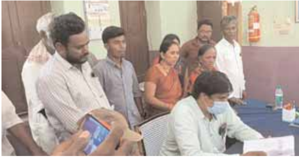
తహసీల్దార్ కార్యాలయంలో బాధితులు.