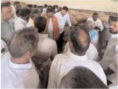
పూడూరు మేజర్ న్యూస్ (మే 28): రైతులు ప్రభుత్వం ఏర్పాటు చేసిన జొన్నల కొనుగోలు కేంద్రంలో

నే విక్రయించాలని ఎమ్మెల్యే రామ్మోహన్ రెడ్డి అన్నారు. మధ్యవర్తులను ఆశ్రయించి సప్లయ్ వద్దని రైతులకు సూచించారు. మంగళవారం మండల పరిధిలోని అంగడి బిట్లంపల్లి వ్యవసాయ సహకార సంఘం ఆధ్వర్యంలో ఏర్పాటు చేసిన జొన్నల కొనుగోలు కేంద్రాన్ని సందర్శించారు. ఏప్రిల్ 30వ తేదీన ప్రారంభమైన జొన్నల కొనుగోలుగడుపు నేటితో ముగియడంతో జొన్నలు విక్రయించుకోవడానికి కాస్త టైం కావాలని రైతులు ఎమ్మెల్యేను కోరగా జిల్లా కలెక్టర్ తో చరవాణిలో సంభాషించి వారం రోజులు పొడిగించాలని కోరారు ఇందుకు జిల్లా కలెక్టర్ సి నారాయణరెడ్డి సానుకూలంగా