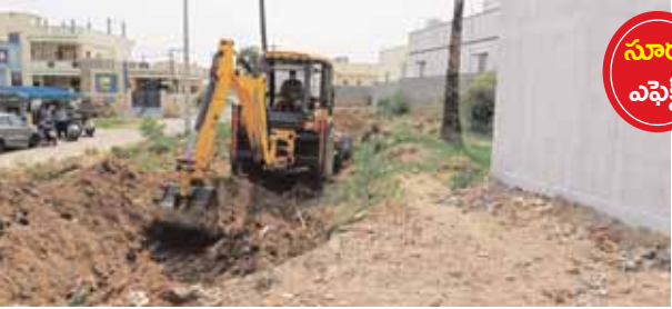
రాంపల్లి పాత చెరువు కాలువను కట్టా చేసి ప్లాట్లు చేసిన దానిని జేసీబీతో తొలగిస్తున్న దృశ్యం.