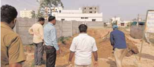
కట్టా చేసిన స్థలంను పరిశీలుస్తున్న అధికార యంత్రాంగం.