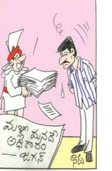
సర్వేలన్నీ మనకు వ్యతిరేకంగా వచ్చినా సరే! సారీ