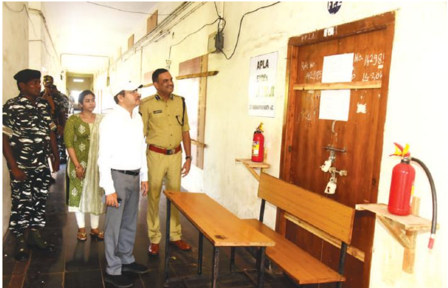
విశాఖపట్నం, మే 21, మేజర్ సూర్య : ఏయూ ఐఓసిఐకి కళాశాల ప్రాంగణంలో ఏర్పాటు చేసిన ఈ పాఠశాల స్ట్రాంగ్ రూమ్లను జిల్లా ఎస్ఐ కలెక్టర్, కలెక్టర్ డా. ఎ. మల్లికార్జున మంగళవారం సాయంత్రం తనిఖీ చేశారు. పార్లమెంటు నియోజకవర్గం స్ట్రాంగ్ రూమ్ తో పాటు అన్ని అసెంబ్లీ నియోజకవర్గాల సంబంధించిన స్ట్రాంగ్ రూమ్లను పోలీసు జాయింట్ కమిషన్