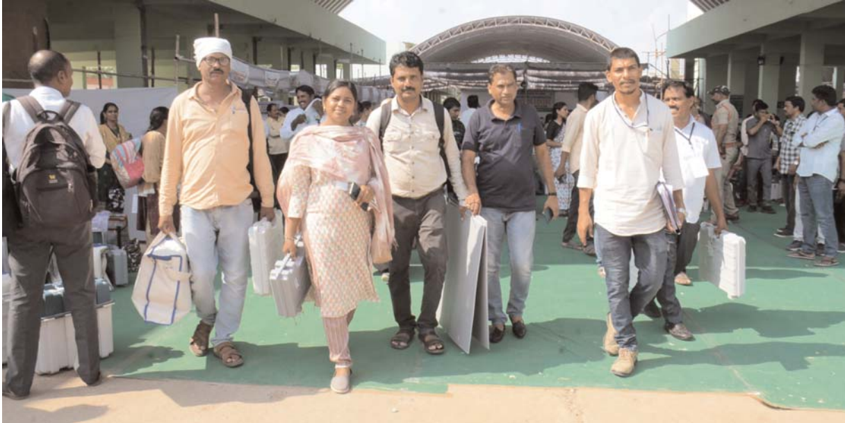
మొదటి పేజీ తరువాయి..

గ్రామాలకు కేంద్ర బలగాలను వినియోగించనున్నారు. సీసీ కెమెరాలు, వెబ్ కాస్టింగ్తో పర్యవేక్షణ చేస్తూ కంట్రోల్ రూమ్లకు వాటిని లింక్ చేయనున్నారు. గంటకోసారి పోలింగ్ సరళి, గొడవలు జరగకుండా తీసుకోవాల్సిన జాగ్రత్తలపై ఆరా తీస్తుంటారు.