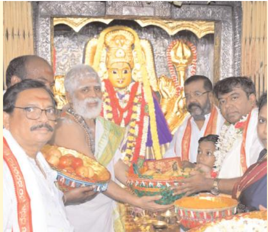
అంగ రంగ వైభవంగా శ్రీ భద్రకాళి భద్రేశ్వరల కళ్యాణ బ్రహ్మోత్సవాలు