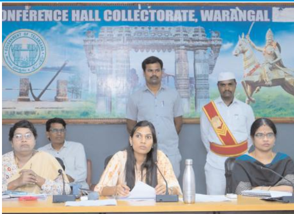
టాయిలెట్లు విద్యుత్ సరఫరా, భూక్ బోర్డు, వెంటనే పూర్తి చేయాలన్నారు. మండల సమాఖ్య లచే ఏకరూప దుస్తుల తయారీలో వేగం పెంచి జూన్