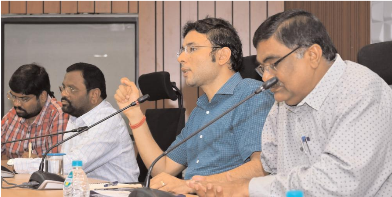
జిల్లా కలెక్టర్ భావేష్ మిశ్ర