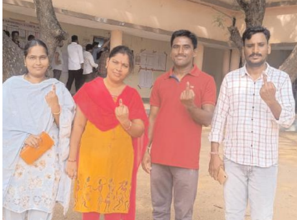
వాటికి పూర్తి భిన్నం ఒకరు ఎంత మందికైనా ఓటు వేసుకోవచ్చు కానీ అది ప్రాధాన్యత క్రమంలోనే వేయాల్సి ఉంటుంది

పెద్దవంగర 27 సూర్య మేజర్ న్యూస్: పెద్ద వంగర మండల కేంద్రంలోని జడ్చీహెచ్ఎస్ పాఠశాల నందు ఓటు హక్కును వినియోగించుకున్నారు ఎన్నికల్లో అభ్యర్థుల సంఖ్య మరి ఎక్కువగా ఉంటుంది రాజకీయ పార్టీలకు చెందిన నేతలే కాకుండా స్వతంత్ర అభ్యర్థులు కనీసం విద్యార్హత డిగ్రీ కలిగి ఉండాలి చాలామంది పోటీ చేసే అవకాశం ఉంటుంది దీంతో బ్యాలెట్ పేపర్ కూడా న్యూస్ పేపర్ సైజులో ఉంటుంది మరోవైపు ఎన్నికల ఓటు కూడా అందరూ వేయలేరు కనీసం ఉన్నత విద్యార్హత డిగ్రీ కలిగి ఉండాలి సదరు నియోజకవర్గానికి చెందిన పట్టభద్రులు ముందుగానే దరఖాస్తు చేసుకుంటూనే ఓటు వేసే అవకాశం ఉంటుంది పోలింగ్ రోజున ఓటు వేయడం హోటల్లో పెద్ద టాన్సు పోలింగ్ బూత్ లోకి వెళ్ళగానే అధికారి మన బ్యాలెట్ పేపర్ పెన్ను ఇస్తారు ఆ పెన్నుతో మాత్రమే ఓటు వేయాల్సి ఉంటుంది సొంతంగా తీసుకెళ్ళిన పెన్నుతోనే స్కెచ్ తోనే వేస్తానంటే కుదరదు అలా వేసిన ఆ ఓటు చెల్లకుండా పోతుంది ఇక పదుల సంఖ్యలో ఉండే అభ్యర్థుల పేర్లతో న్యూస్ పేపర్ ను తలపించేలా బ్యాలెట్ పేపర్ ఉంటుంది అందులో కేవలం అభ్యర్థుల పేర్లు ఫోటో బాక్స్ ముద్రించి ఉంటుంది సార్వత్రిక స్థానిక సంస్థల ఎన్నికల్లో ఎవరో ఒక్క అభ్యర్థికి మాత్రం ఓటు వేయాల్సి ఉంటుంది ఒకరి కంటే ఎక్కువ మందికి ఓటు వేస్తే అది కాస్త చల్లకుండా పోతుంది కానీ ఇక్కడ మాత్రం