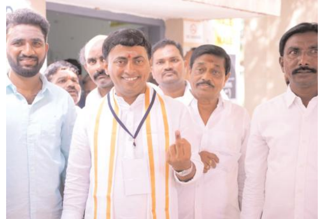
ఓటు హక్కును వినియోగించుకున్నారు.