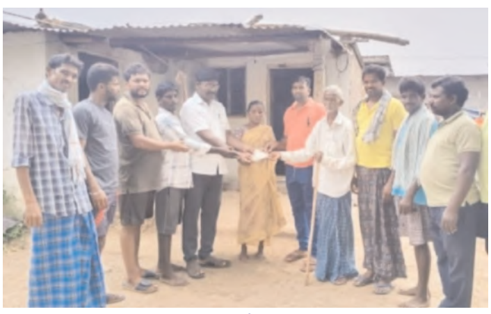
అపద అనగానే ప్రతి ఒక్కరు