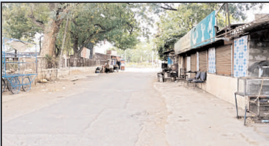
విజయపురి సౌత్, మేజర్ న్యూస్