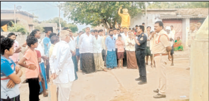
శావల్యాపురం, మేజర్ న్యూస్

మండలంలోని కొత్తలూరు, తుమ్మలకుంట గ్రామాల్లో పోలీసులు ఆదివారం కారెన్ సెర్వి నిర్వహించారు. గ్రామాలలో 144 సెక్షన్ అమలులో ఉన్న కారణంగా ఎటువంటి అవాంఛనీయ సంఘటనలు జరగకుండా పోలీసులు కట్టుదిట్టమైన భద్రత ఏర్పాటు చేశారు. ఈ సందర్భంగా వారు మాట్లాడుతూ ఎన్నికల కౌంటింగ్ సందర్భంగా గ్రామాల్లో శాంతి భద్రతలకు విఘాతం కలిగిస్తే కఠిన చర్యలు తీసుకుంటామని అన్నారు. గ్రామాలలో ప్రజలకు కౌన్సిలింగ్ ఇచ్చారు. ప్రస్తుతం 144 సెక్షన్ అమలులో ఉన్నందున యువత తగాదాల జోలికి వెళ్లవద్దని, కేసు నమోదైతే భవిష్యత్తుకే ఇబ్బంది అని హెచ్చరించారు. అందరూ స్నేహపూరిత వాతావరణంలో మెలగాలని సూచించారు. గ్రామాల్లో గొడవలకు దిగితే చట్టపర చర్యలను ఎదు రోహాల్ని ఉంటుందని వారు హెచ్చరికలు జారీ చేశారు. కౌంటింగ్ రోజు, మరుసటి రోజు ఎటువంటి బానా సంఘే పేల్చడానికి గాని, ర్యాలీలకు గాని పర్యవేక్ష లేదన్నారు.