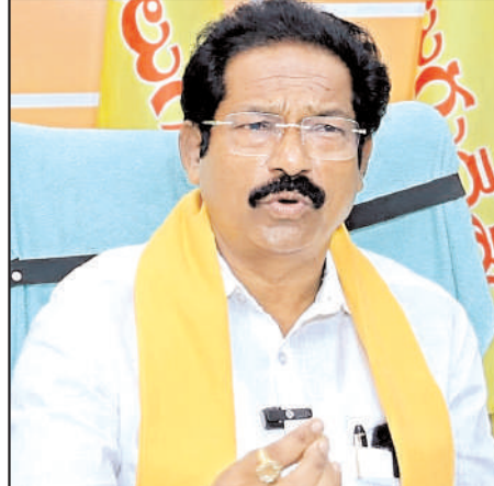
తెలుగుదేశంతో సాధ్యమని ఈ స్థాయి మద్దతిచ్చారని తెలిపారు. హెారా హెారీగా సాగిన ఈ ఎన్నికల ద్వారా చంద్రబాబు పోరాట స్ఫూర్తిని యావత్ దేశం

పాలన, ముఖ్యమంత్రి జగన్ రెడ్డి ఆరాచకాలు, దుర్మార్గాల పట్ల ప్రజలు ఎంతగా విసిగి పోయాలో ఎగ్జిట్ పోల్ ఫలితాలు కూడా స్పష్టం చేశాయన్నారు. రాయలసీమ నుంచి ఉత్తరాంధ్ర వరకు సైకే ముఖ్యమంత్రి జగన్ రెడ్డిని తరిమి కొట్టి చంద్రబాబును ముఖ్యమంత్రిని చేసుకోవాలనే ప్రజలందరూ కృతనిశ్చయంతో ఓట్లెక్కినప్పటికీ అర్థం అవుతుందన్నారు. అయిదేళ్ల సరకం నుంచి మార్పుకోరుతూ యువతరం నుంచి వృద్ధుల వరకు ప్రతి ఒక్క వర్గం వారు తెలుగుదేశం కూటమివైపు నిలవబట్టే కనీ విని ఎరగని విజయం సాధించబోతున్నా మనీ పునరుద్ధానించారు. అయిదేళ్లలో అన్నివిధాల గాడి తప్పిన రాష్ట్రాన్ని తిరిగి నిలబెట్ట గలిగిన శక్తి సామర్థ్యాలు, దార్శనికత చంద్రబాబుకే ఉందని ప్రజలు నమ్మారనడానికి రానున్న ఫలితాలే తిరుగులేని నిదర్శనమన్నారు. పోలవరం, అమరావతి పూర్తి కావాలన్నా, యువతకు ఉద్యోగం, అన్నివర్గాలకీ సంక్షేమం