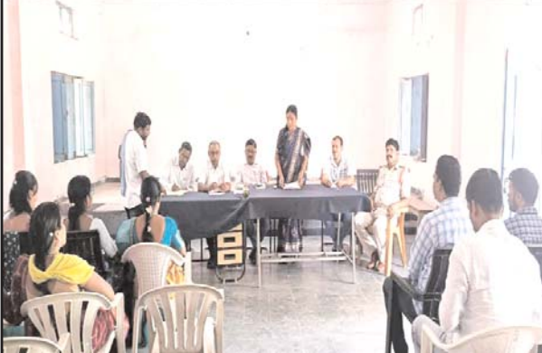
సమావేశంలో మాట్లాడుతున్న అధికారులు