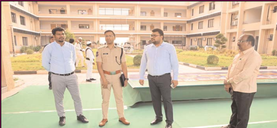
మంచీర్యాల ప్రతినిధి, జూన్ 01, సూర్య మేజర్ న్యూస్ :