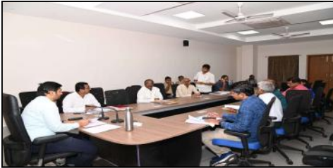
ఆసిఫాబాద్ ప్రతినిధి 19 జూన్ సూర్య మేజర్ న్యూస్