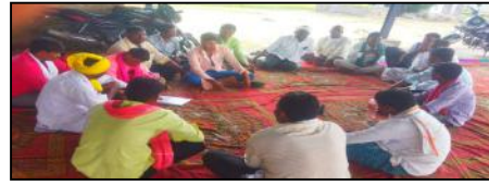
జైసూర్ మే 11 సూర్య మేజర్ స్టూన్

జైసూర్ మండలంలోని అన్ని గ్రామ పంచాయతీల కార్యకర్తలు కామటీలు ద్రైవర్ల మరియు గ్రామ పంచాయతీల కార్మికులు గత ఆరు నుండి ఏడు నెలలుగా వేతనాలు రాక ఏమీ తోచిన స్థితిలో ఉన్నారు. మంగళవారం జైసూర్ కేంద్రంలో అన్ని గ్రామ పంచాయతీల కార్మికులు సమావేశం ఏర్పాటు చేసి దళారుల నుండి దబ్బులు మితికి తీసుకుందామని నిర్ణయం తీసుకున్నారు. సరైన సమయంలో మేము చేసే పనికి ఇంట్లో కుటుంబ భోషన రోజు రోజుకి భారంగా మారుతుందని, ఇప్పటికే ఒక్కో కార్మికుడు 50 వేల వరకు అప్పు చేసి కుటుంబాన్ని పోషిస్తున్నారు. ప్రభుత్వం నుంచి ఎలాంటి స్పందన వచ్చింది లేదు. ప్రభుత్వం అన్ని రకాల గ్రామ పంచాయతీ కార్మికులకు వారుకొని వేతనాలు విషయంలో చిన్న చూపు చూస్తుందని ఆకలితో పని చేయమని జైసూర్ మండలంలోని అన్ని గ్రామ పంచాయతీల కార్మికులు సమావేశం నిర్వహించడం జరిగింది.