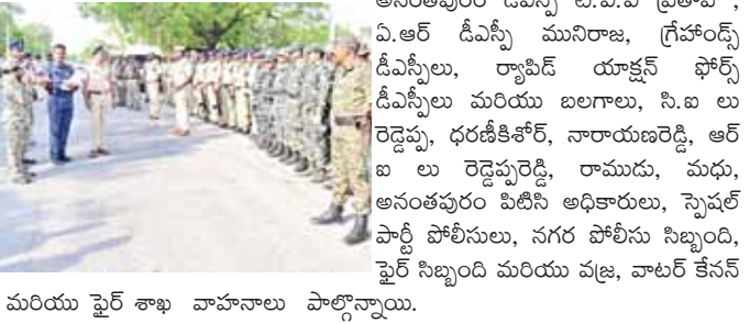
మరియు ఫైర్ శాఖ వాహనాలు పాల్గొన్నాయి.