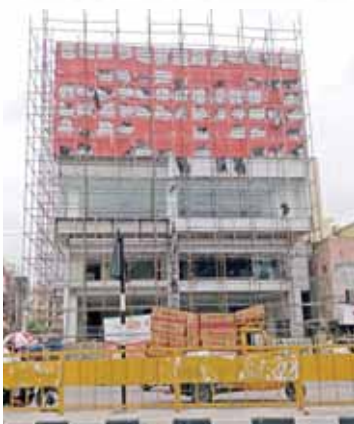
అనంతపురం కమలానగర్ లో వెలసిన ఈ భవంతులన్నీ రెసిడెన్షియల్ నిర్మాణం అనుమతి తీసుకొని కమర్షియల్ గా ఏర్పాటైనవే...

ఒకటి కాదు.. రెండు కాదు.. 10 కాదు.. 100 కాదు..