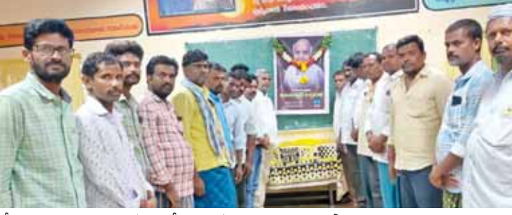
పేర్కొన్నారు. ఈ కార్యక్రమంలో నాయకులు తదితరులు పాల్గొన్నారు.

నల్లమాడ, మేజర్ న్యూస్ : ఈనాడు సంస్థల అధినేత రామోజీ రావు ఆకస్మిక మృతి పట్ల మండల కేంద్రమైన నల్లమాడలో శనివారం ఆర్టిఓ కార్యాలయంలో సమావేశం నిర్వహించి ఘన నివాళులర్పించారు. ఈ సందర్భంగా నే నాయకులు మాట్లాడుతూ ఈనాడు సంస్థల అధినేత రామోజీరావు చేసిన సేవలను కొనియాడారు. అంతేకాకుండా ఈనాడు పేపర్ స్థాపించి ఎంతోమందికి స్ఫూర్తిని సుంచి మహానుభావ వ్యక్తిగా ప్రపంచ స్థాయి గుర్తింపు పొందారని