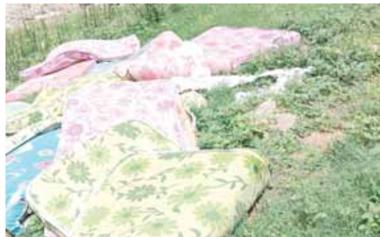
నదికి దగ్గరలో నివాసం ఉంటున్న ప్రజలు పారిశుధ్యంలో లోపించి అనారోగ్యానికి గురవుతున్నారు. ఇప్పటికైనా అధికారులు వ్యర్థాలను వేయకుండా తగు చర్యలు తీసుకోవాలని స్థానికులు కోరుతున్నారు.

పుట్టపర్తి రూరల్ మేజర్ న్యూస్ : సత్యసాయి నదయాడిన చిత్రావతి నది పరివాహక ప్రాంతాన్ని స్థానికులు వ్యర్థ పదార్థాలు చెత్తచెదారం వదిలేయడం పట్ల భక్తులు పర్యాటకులు ఇబ్బంది పడుతున్నారు. చిత్రావతి సుందరీకరణ కోసం, నది మధ్యలో నిర్మించిన చెక్ డ్యామ్ కు ప్రభుత్వం సుమారు 15 కోట్ల వరకు వ్యయం చేసింది. నది పరివాహక ప్రాంతంలో పర్యాటకులను అహలద్ద పరిచే విధంగా అభివృద్ధి చేయాలని ఒకవైపు ప్రభుత్వం అధికారులు రాజా ప్రతినిధులు ప్రతిపాదనలు సిద్ధం చేస్తున్నారు. మరోవైపు స్థానికులు తమ ఇండ్లలోని వ్యర్థాలను నది ఒడ్డున పారవేయడం జరుగుతోంది. పుట్టపర్తి కి వచ్చే దేశ విదేశీ భక్తులు పర్యాటకులు చిత్రావతి నదిని పవిత్రంగా భావిస్తూ స్వచ్ఛందంగా నది పరిసరాలను శుభ్రం చేస్తున్నారు. వారు ఒకవైపు శుభ్రం చేస్తుంటే స్థానికులు కొందరు రాత్రి కి రాత్రే చెత్తచెదారం పెడతాలను పారవేస్తున్నారు. నదీ పరివాహకంలో వ్యర్థాల వలన